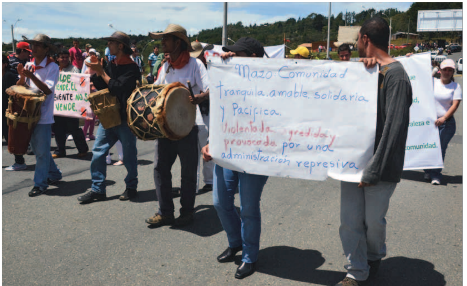
Comunidad tranquila, amable y pacífica, dicen los "maceños" (gentilicio de la gente de la Vereda Mazo). Y de eso no debe quedar duda.

La comunidad de la Vereda Mazo, un año después de la demolición de su sede mutual en junio del 2010, aún espera que la Administración Municipal le concrete por escrito soluciones sobre el reemplazo de ese espacio comunitario. El pasado 12 de junio marcharon para no olvidar y siguen solicitando respuestas por parte de la Alcaldía de Medellín