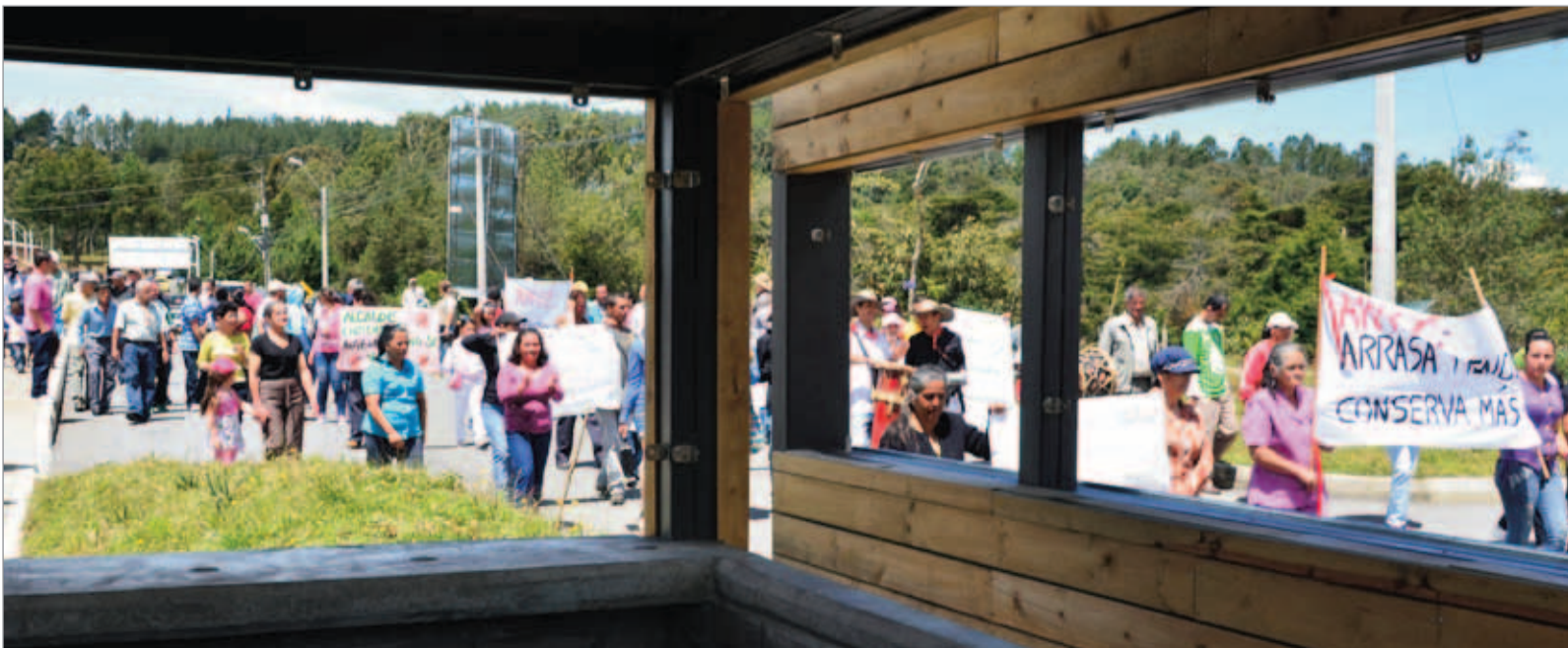
La población marchó tranquila el pasado 12 de junio para recordar y no olvidar la demolición de su sede mutual, un año atrás.

inicio para iniciar las obras que faltan en esta primera etapa. De otro lado, dice la Administración Municipal que será la Secretaría de Cultura Ciudadana la que maneje todos los espacios que se construirán en la Plazoleta de Mazo. La idea es hacer un reglamento de uso de esos espacios. De igual forma, quedará un pequeño lote, de unos 60 metros, en el que se puede hacer una nueva sede para la comunidad que reclama su espacio mutual y ese lugar también estará sujeto al mismo reglamento, que señala la Administración Municipal se hará de manera concertada con la comunidad. Dicen algunos representantes de la comunidad que les han informado que sí tendrán un espacio en las nuevas construcciones, pero aún no hay ningún documento escrito al respecto. Este documento escrito, señalan los líderes de la Vereda, es fundamental para la tranquilidad de la población de Mazo.