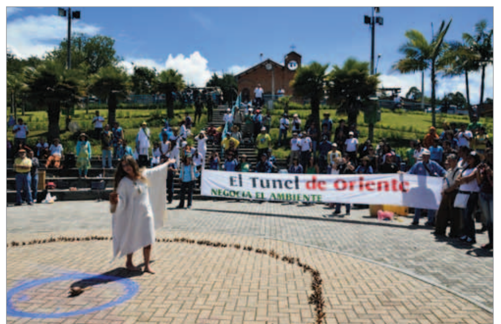
Ritual por el agua. Invocando las fuerzas del agua, antes de salir.