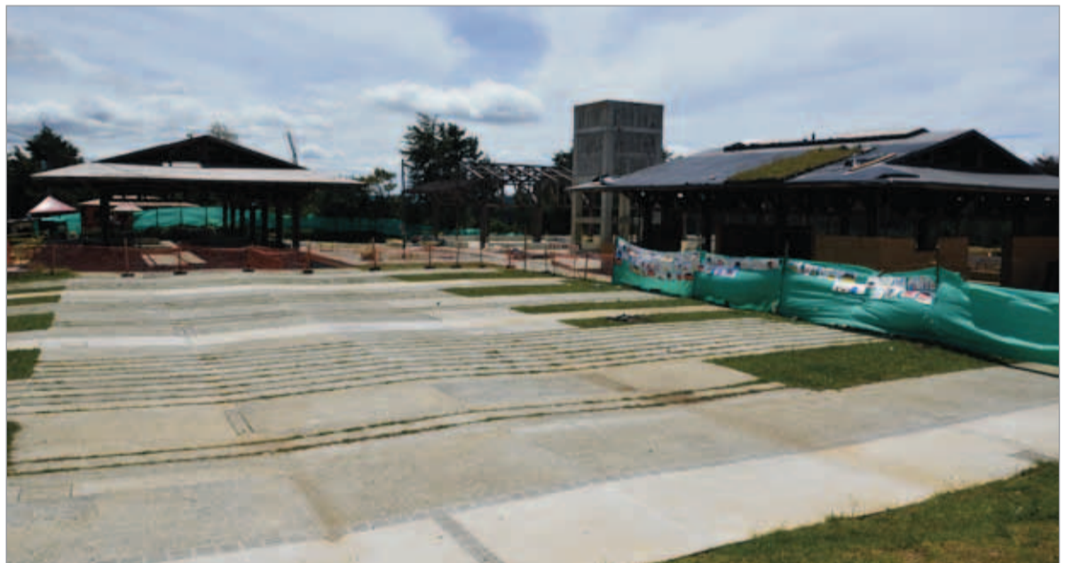
Las obras de la plazoleta, suspendidas hace más de un año.

Es así como se abrió una licitación para el reinicio de las obras faltantes en la plazoleta de Mazo, convocatoria que fue adjudicada a la empresa Pórticos Ingenieros