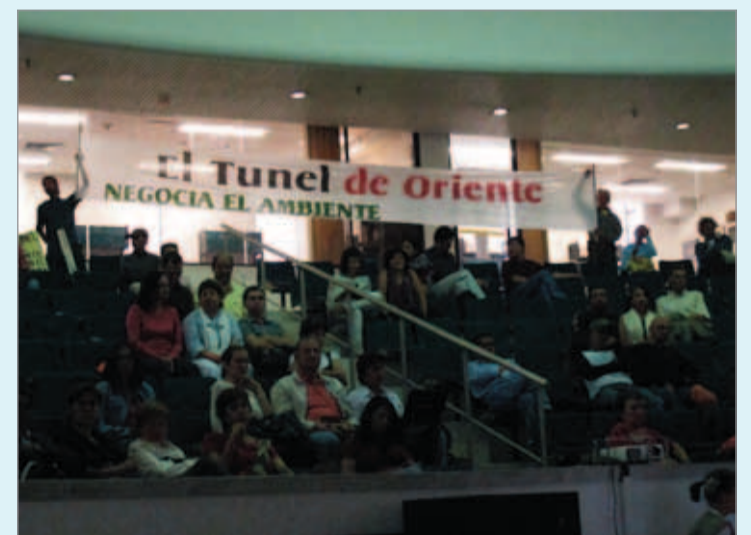
Sesión del Concejo de Medellín, el pasado 1° de julio, en la que se debatieron los aspectos del proyecto.