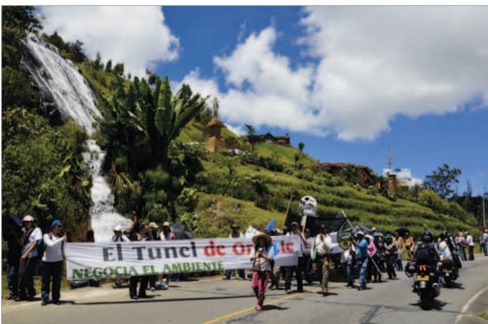
11 más 200. Pasando por el 11 más 200, uno de los sectores de más alta vulnerabilidad de la vía a Santa Elena.

Pintura corporal. Una de las artistas, con su cuerpo completamente pintado en representación del agua, hizo un bello homenaje y sorprendió a los caminantes, pues hizo toda la marcha de aproximadamente 16 kilómetros, desnuda y en chanclas.