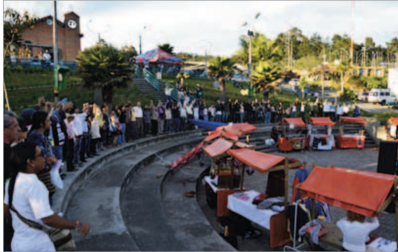
Abraza a la montaña, realizado el pasado 12 de junio en el parque principal de Santa Elena.

En el último mes se vienen dando diferentes acciones por parte de las organizaciones ambientales y la comunidad agremiada del Corregimiento de Santa Elena y zonas aledañas para frenar las obras del macroproyecto Túnel de Oriente