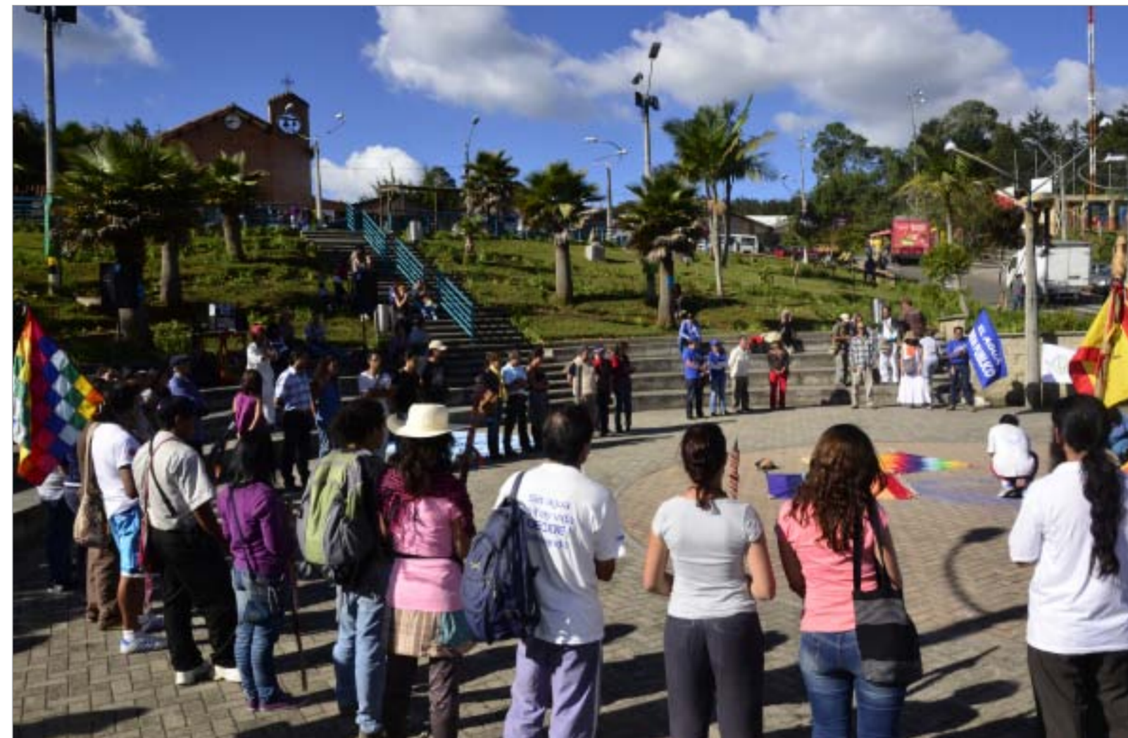
Imagen de la llegada a Santa Elena de la Gran Marcha Ceremonial por el Agua, el pasado 13 de agosto.

Las organizaciones ambientalistas siguen trabajando para evitar la construcción del proyecto Túnel de Oriente. En los últimos días, varias acciones jurídicas se han presentado para continuar reclamando por las inconsistencias jurídicas y ambientales de la iniciativa. Muchas de estas acciones, sin precedentes en Medellín