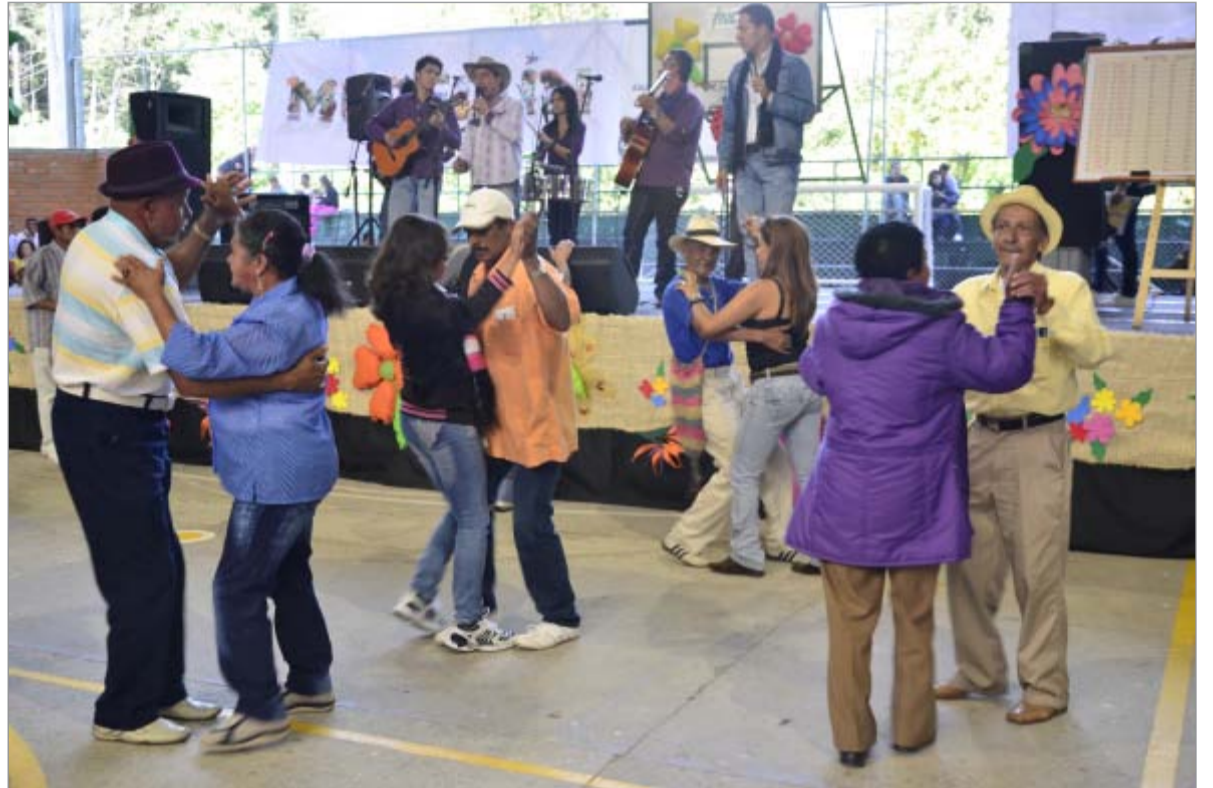
Un poquito más caliente es el asunto y se bailaban los grupos que trajeron de otros corregimientos.

El pasado 6 de junio se celebró el Día del Campesino en el corregimiento. Los asistentes gozaron con las actividades y fueron muchos los que bailaron y disfrutaron. Cada año la comunidad campesina del corregimiento espera esta fiesta con ansias pues es la oportunidad para celebrar su condición y sus tradiciones. Sin embargo, algunos asistentes piden a la Administración hacer una fiesta acorde a las condiciones y reconociendo el talento local, con valores equitativos de pago para los músicos locales. Se reconoce que los grupos artísticos de Santa Elena fueron llevados a otros corregimientos para intercambiar los saberes y talentos corregimentales, pero aún se hace necesario que los grupos y los artistas sean mejor remunerados, con criterios de equidad y responsabilidad social con los territorios. Durante la fiesta, también se hicieron reconocimientos a Arpse, a Cootrapiedras y la Mesa de Comunicaciones Santa Elena te Cuenta