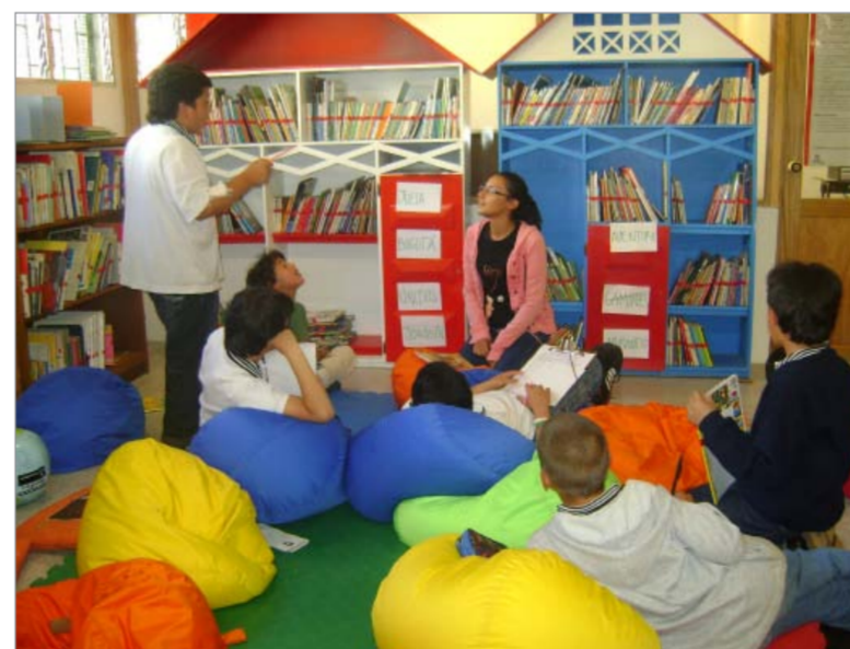
Múltiples actividades se desarrollan en la biblioteca de Santa Elena.

Hace (20) años surgió la Biblioteca de Santa Elena, como propuesta de la Acción Comunal del Corregimiento para conformar un espacio bibliotecario en las instalaciones del antiguo Campín, hoy Casa de Gobierno, para luego erigirse como Biblioteca Pública Escolar de Núcleo, actualmente Biblioteca Corregimental. El empeño obstinado de un grupo de personas que con su voluntad y compromiso, al ritmo de tonadas y rasgueo de guitarras, no cesaron en su afán hasta adecuar un lugar como el que hoy disfrutan los habitantes de Santa Elena y los cientos de turistas que la visitan y la recorren como un erario más, ubicado en la centralidad de este corregimiento.