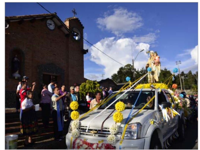
La Virgen a su llegada al corregimiento, enmarcada en flores.

El pasado 18 de julio, los conductores del corregimiento le rindieron homenaje a su patrona, la Virgen del Carmen, cuyo día es el 16. La procesión salió a las 3 y 30 de la tarde hacia la glorieta del Aeropuerto José María Córdova y regresó a la parte central para la celebración de la misa.