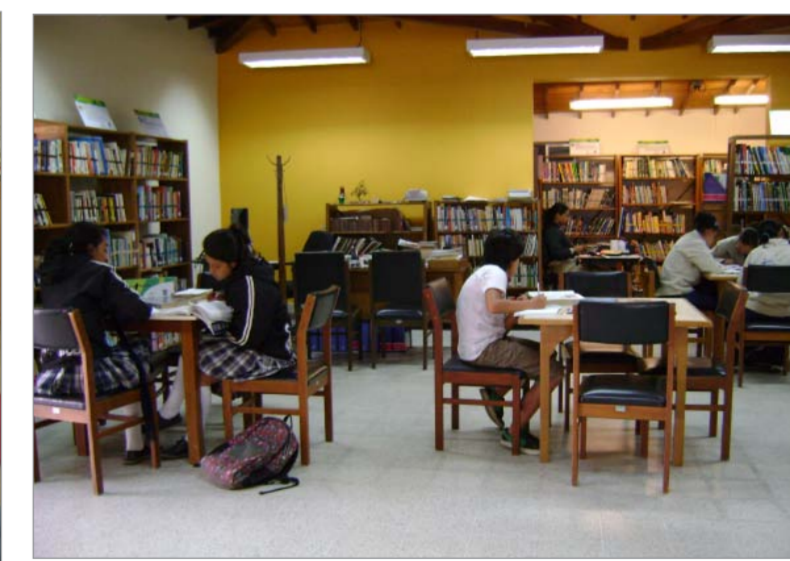
20 años nos queda cuando la biblioteca acompañamos a la comunidad que estamos importante.

ja esta biblioteca llena de Libros, como un jardín lleno de flores. Actualmente la biblioteca brilla con la luz que aquella mujer soñó para una ciudad, para una sociedad en permanente desarrollo. Las salas siempre están llenas de niños, jóvenes y adultos. Como todas las bibliotecas del mundo, está compuesta de saberes y recuerdos. Siempre abierta para aquellos que saben del placer y el gusto por la lectura, goce que, como un duendecillo,