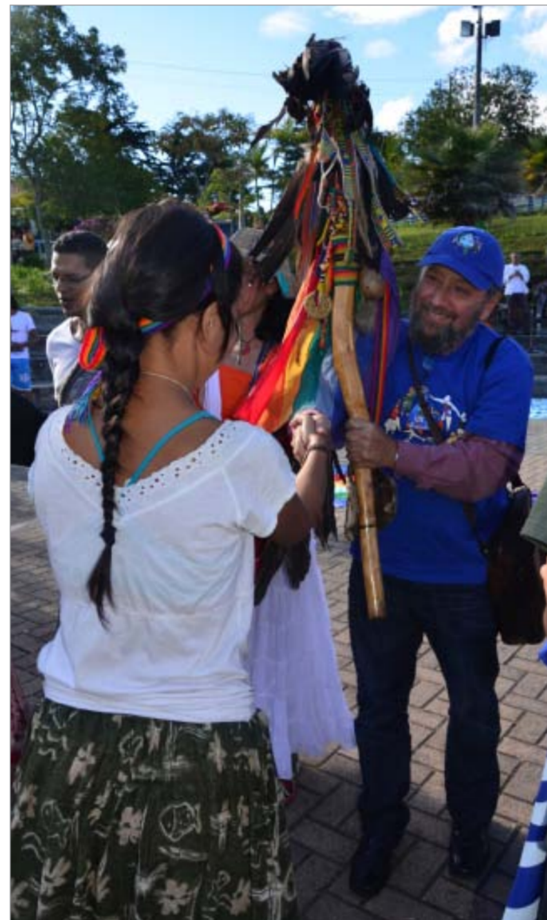
Los bastones fueron entregados a los asistentes como símbolo de la ceremonia y como compromiso para defender también el agua como un derecho.

El agua vive un ciclo permanente a través de los tiempos. En forma gaseosa sube al cielo y luego baja para nutrir los ríos y montañas. Su mágico círculo es potestad y simiente para todos.