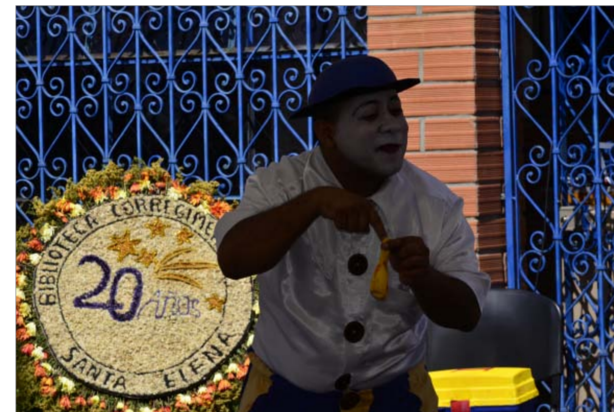
Celebración de los 20 años de la biblioteca, el pasado 3 de julio.