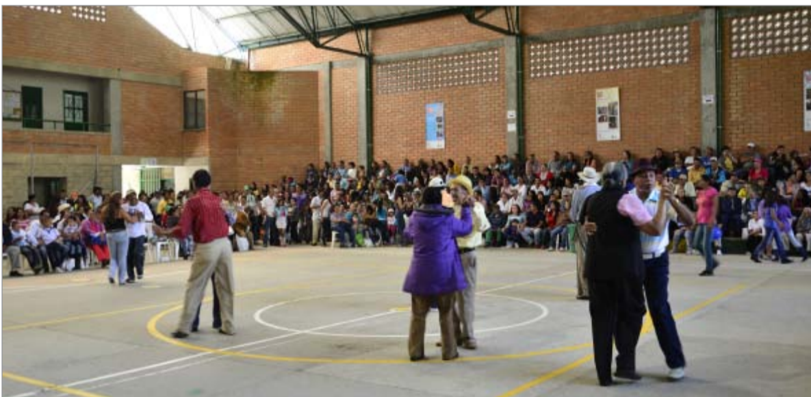
Apenas empezando las parejas que bailaban eran pocas. Sin embargo, ellas sin pena, bailaron así el resto de la fiesta.