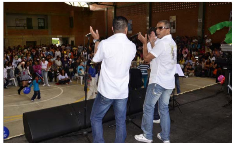
Caneo orquesta que puso a bailar a los asistentes al final de la fiesta, aunque algunos insisten que se trata de una agrupación más urbana que rural.