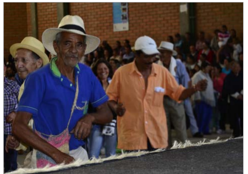
En la fiesta, estos asistentes que no dejaban bailar y buscaban parejas distintas para no perderse el baile.