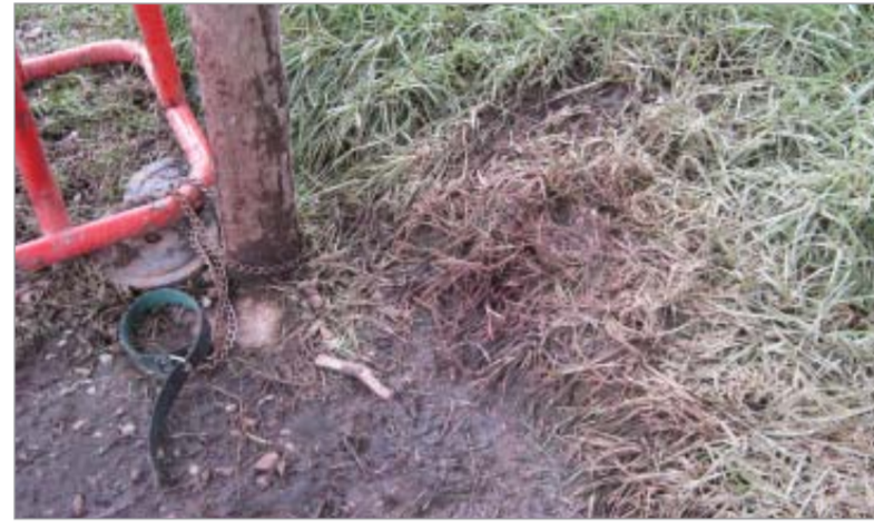
Lugar donde estuvo amarrado el perro.