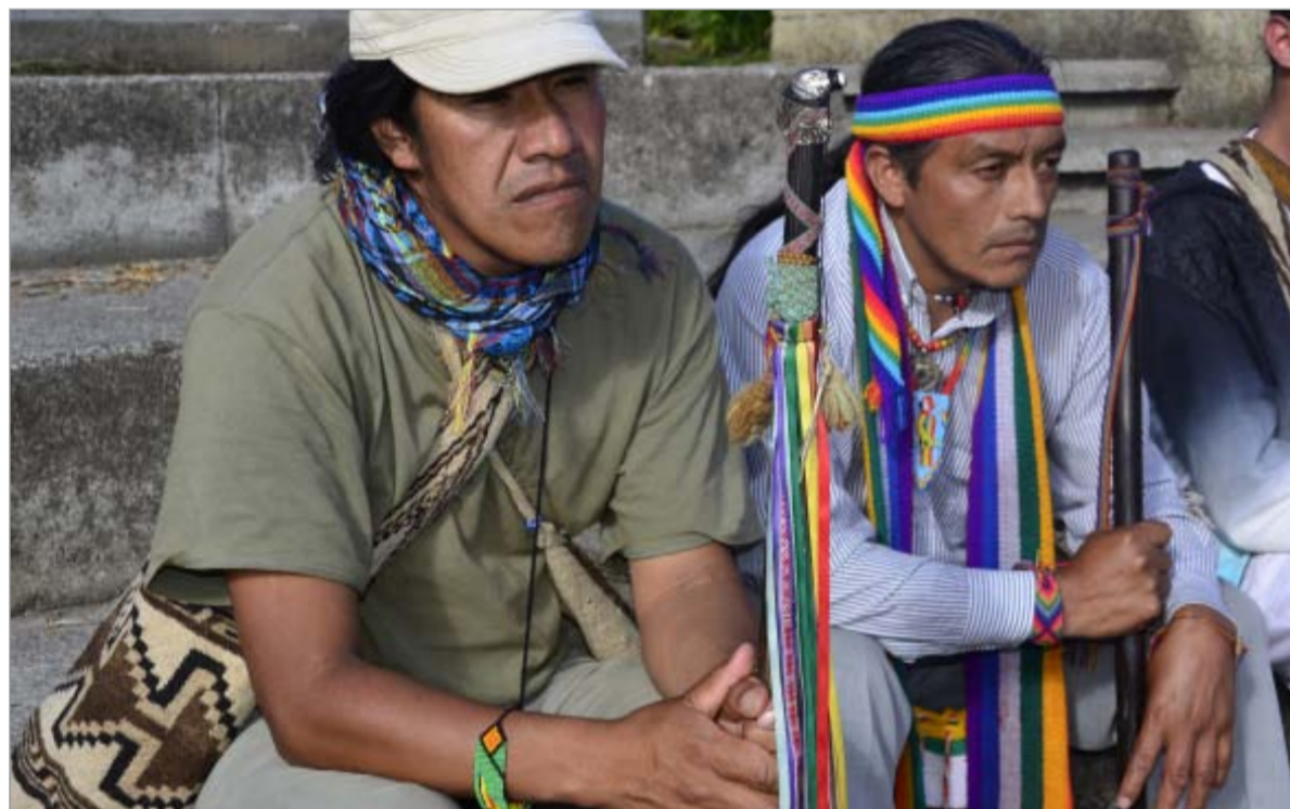
Los guerreros del arcoiris, hermanos indígenas defensores de los derechos de las comunidades ancestrales.

llas de luz en los corazones de los seres que habitamos la Madre Tierra. Y la hacen corriendo porque correr es una forma vital de la vida ceremonial y tradicional de los pueblos originarios (indígenas). Con el correr se han venido honrando todas las formas de la vida representadas en las varas o bastones tradicionales que encabezan las líneas de corredores. De esta forma los bastones permiten entrelazar esfuerzos y entretener propósitos y pasos sobre la tierra, como una manera de reafirmar las raíces y sostener la identidad. La marcha llegó a Santa Elena también como una acción directa no violenta para protestar por el proyecto Túnel de Oriente.