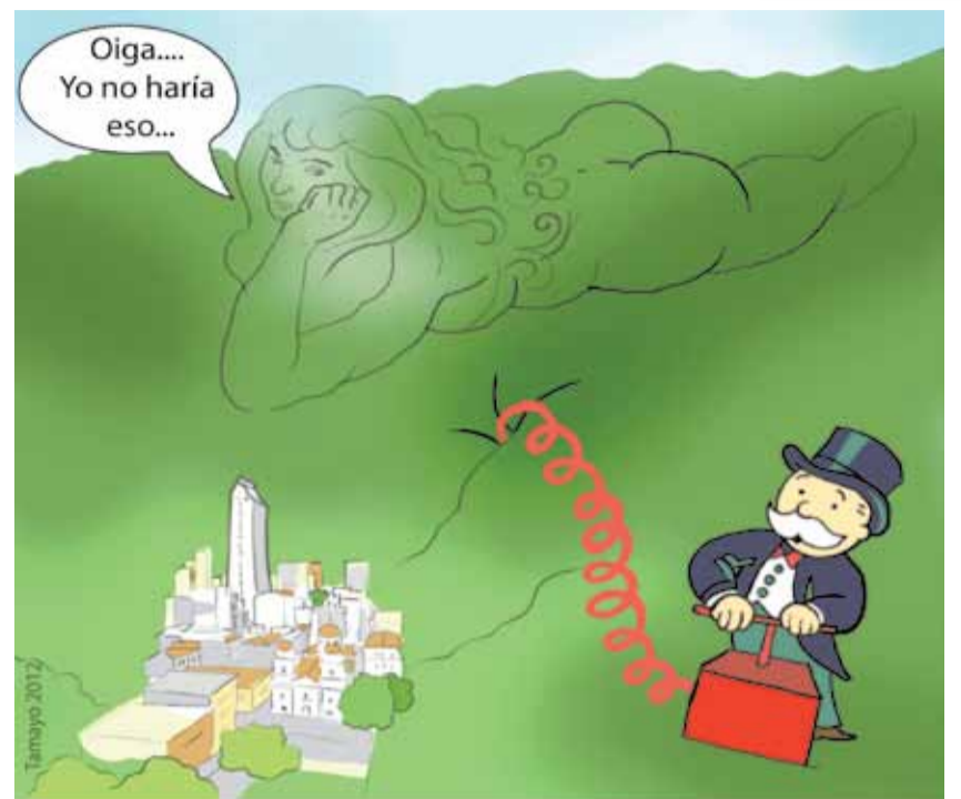
Dios perdona siempre, el hombre a veces, la naturaleza no perdona nunca...