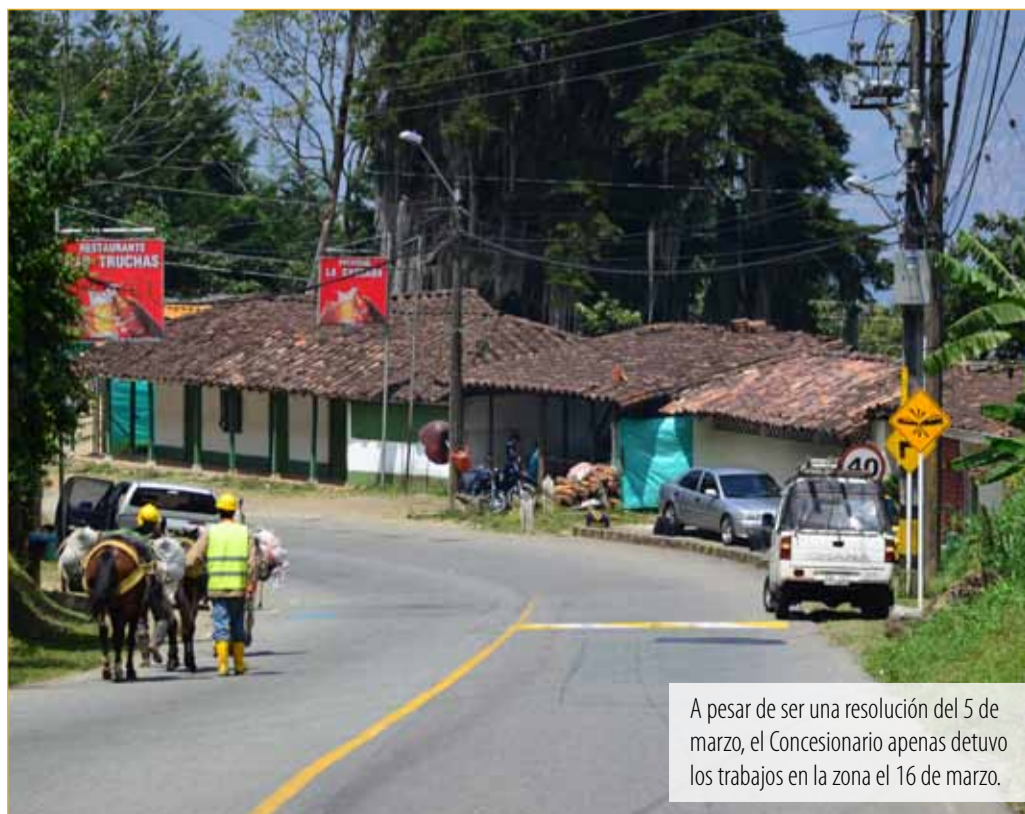
A pesar de ser una resolución del 5 de marzo, el Concesionario apenas detuvo los trabajos en la zona el 16 de marzo.