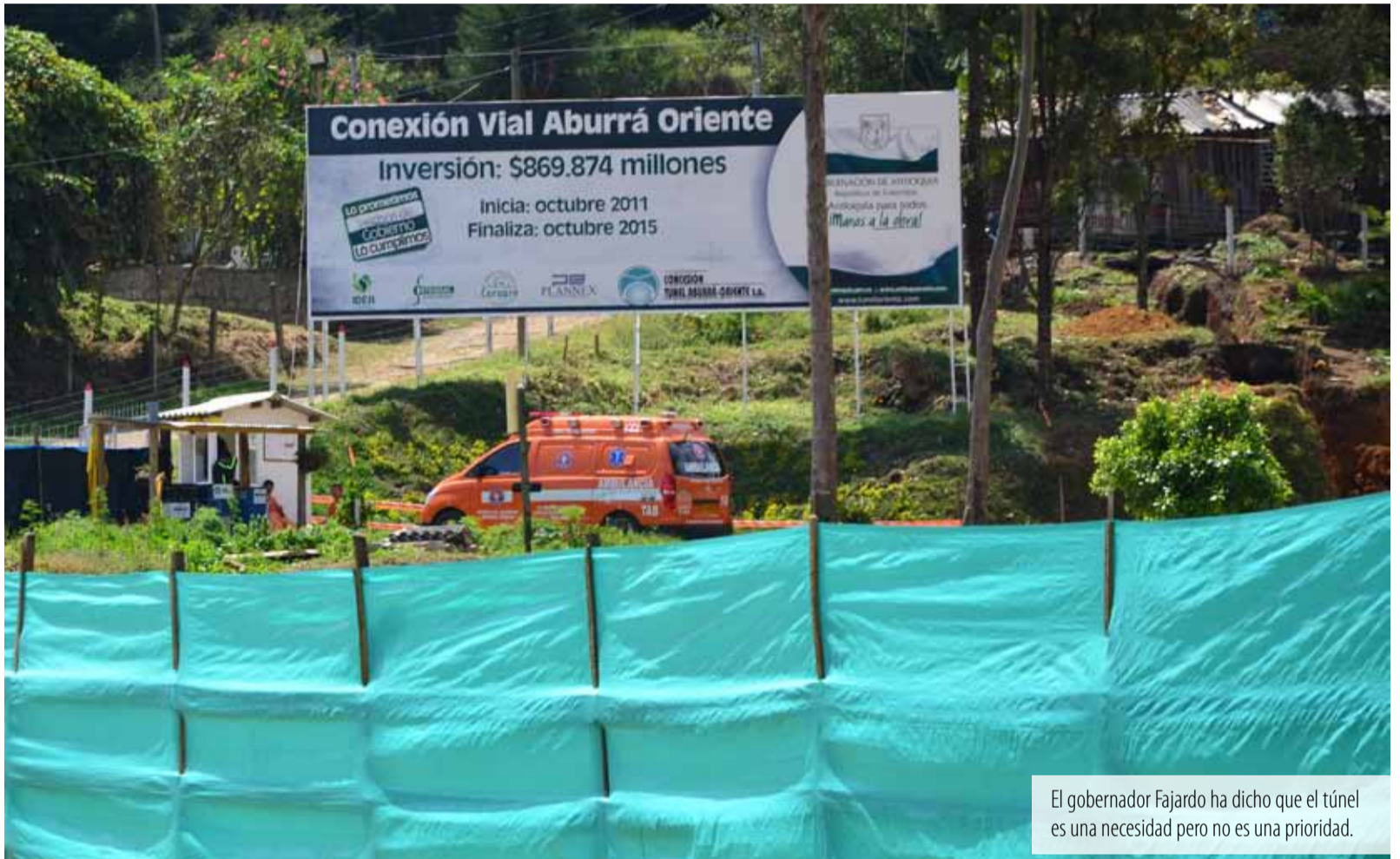
El gobernador Fajardo ha dicho que el túnel es una necesidad pero no es una prioridad.

*Diputado a la Asamblea de Antioquia por el Polo Democrático.