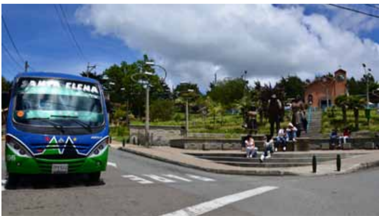
Explicó Trasancoop que los transportadores de la ciudad se pusieron de acuerdo para incrementar el valor del pasaje sólo a partir del 1° de julio. Para el caso de Santa Elena, el valor subirá 100 pesos, en cada uno de los trayectos.

tos, las que salen de Las Brisas y van al centro”, dijo. El resto del tiempo la frecuencia es de 12 minutos y a partir de las 3 de la tarde arranca de nuevo cada 10 minutos, explicó Zapata Hincapié. De igual forma, indicó que se abrió una nueva ruta hacia la Vereda El Cerro, cada hora y se espera el permiso del Municipio de Envigado para prestar el servicio hasta Pantanillo. Por ahora las busetas para y desde El Cerro salen a las 5:35 a.m., a las 6:35 a.m. y de nuevo a las 12:50 del mediodía. Luego a las 6:45 y a las 7:45 de la noche, entre la zona urbana y la vereda. Con las nuevas busetas, Trasancoop queda con 21 vehículos y un mayor número de sillas, porque cada uno de estos nuevos tiene 37 sillas. Es de resaltar que son carros con tecnología Euro4, lo que reduce la emisión de gases y ya la empresa completa 5 de estos, amigables con el ambiente, tal como lo señala la norma para empresas de transporte público en Colombia, con lo que además Trasancoop se pone a la vanguardia.