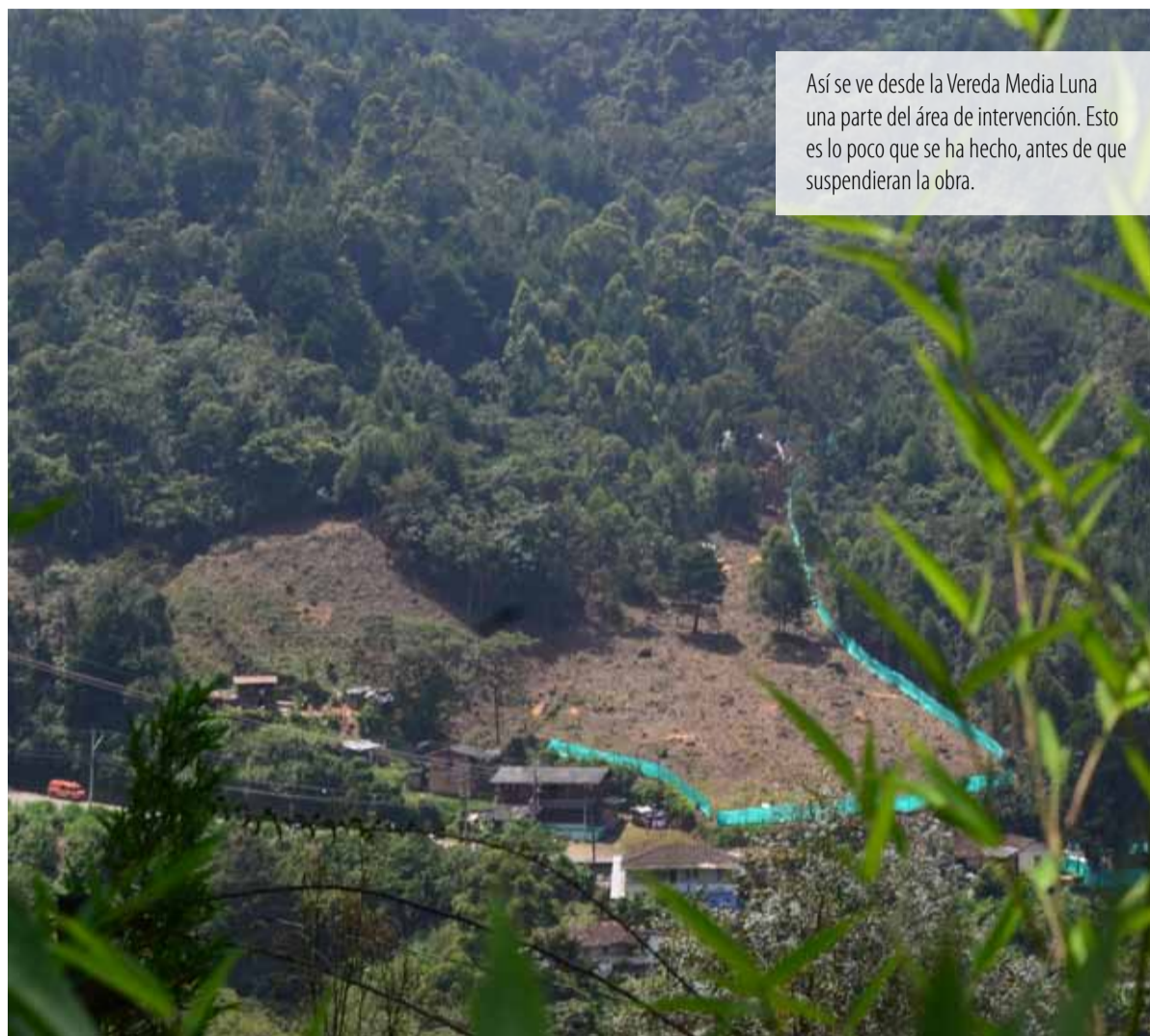
Así se ve desde la Vereda Media Luna una parte del área de intervención. Esto es lo poco que se ha hecho, antes de que suspendieran la obra.

Por su parte, el 12 de enero en Medellín, el ministro de Ambiente y Desarrollo Sostenible, Frank Pearl dijo que “Hemos decidido desde el Ministerio asumir la competencia y exigir la suspensión de las obras para obtener información y entrar en un trabajo conjunto con la Gobernación de Antioquia, la Alcaldía de Medellín, la Autoridad de Licencias, Corantioquia y Cornare, con el