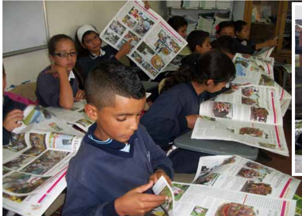
Niños del Centro Educativo Juan Andrés Patiño, de Barro Blanco, en actividades de clase, aprendiendo con VIVIENDO SANTA ELENA.