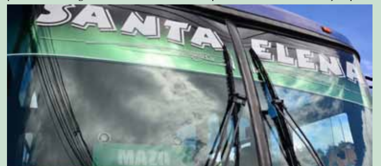
Trasancoop moviliza por día unos 5 mil usuarios. En fines de semana, de esos 5 mil usuarios, unos 2 mil van para la zona de Arví.

El periódico VIVIENDO SANTA ELENA había postulado a Trasancoop para el premio Colombiano Ejemplar que otorga cada año el Periódico El Colombiano, en la categoría Solidaridad. Sin embargo, no fue escogido dentro de los ganadores 2012. Para nosotros como medio de comunicación Trasancoop tiene un alto sentido de responsabilidad social, tal como lo ha demostrado siempre, desde sus directivas hasta todos y cada uno de los conductores, empleados y despachadores. Por eso lo postulamos como Colombiano Ejemplar. Esa responsabilidad social se ha reflejado en momentos críticos, por ejemplo cuando la vía ha estado cerrada y la empresa, sin poder incrementar el pasaje por falta de autorización del Ministerio, ha trabajado a pérdidas para continuar prestando el servicio. De otro lado, el constante ánimo de mejoramiento de la empresa la hacen una de las más prósperas de Santa Elena y fuente de empleo permanente para muchas familias. De nuevo y aunque El Colombiano no lo haya reconocido así, para VIVIENDO SANTA ELENA Trasancoop es una empresa ejemplo, que representa orgullo para este corregimiento. Por eso decimos que es el Santaelenense ejemplar.