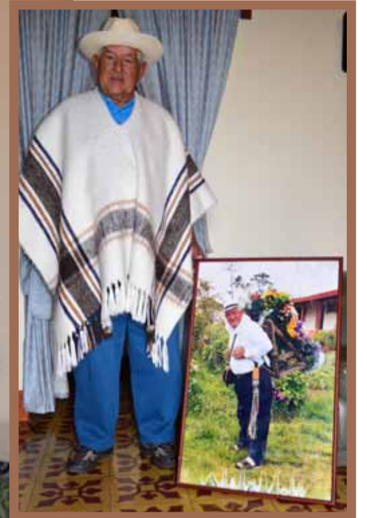
“Hoy hay más comodidad, modernismo, pero Santa Elena siempre ha sido bueno. Hoy, no se camina, se anda en carro, en moto, todo el mundo llega en su vehículo, ya no se distingue entre un montañero y una persona de Medellín”, afirma.