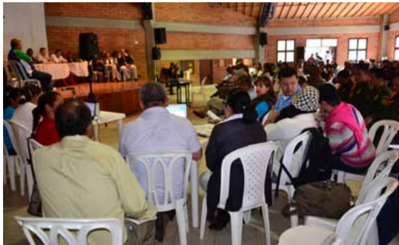
Sesión descentralizada del Concejo de Medellín en Santa Elena para hablar sobre el servicio de salud. Los concejales se comprometieron a buscar alternativas para la prestación de un mejor servicio de salud en el corregimiento.