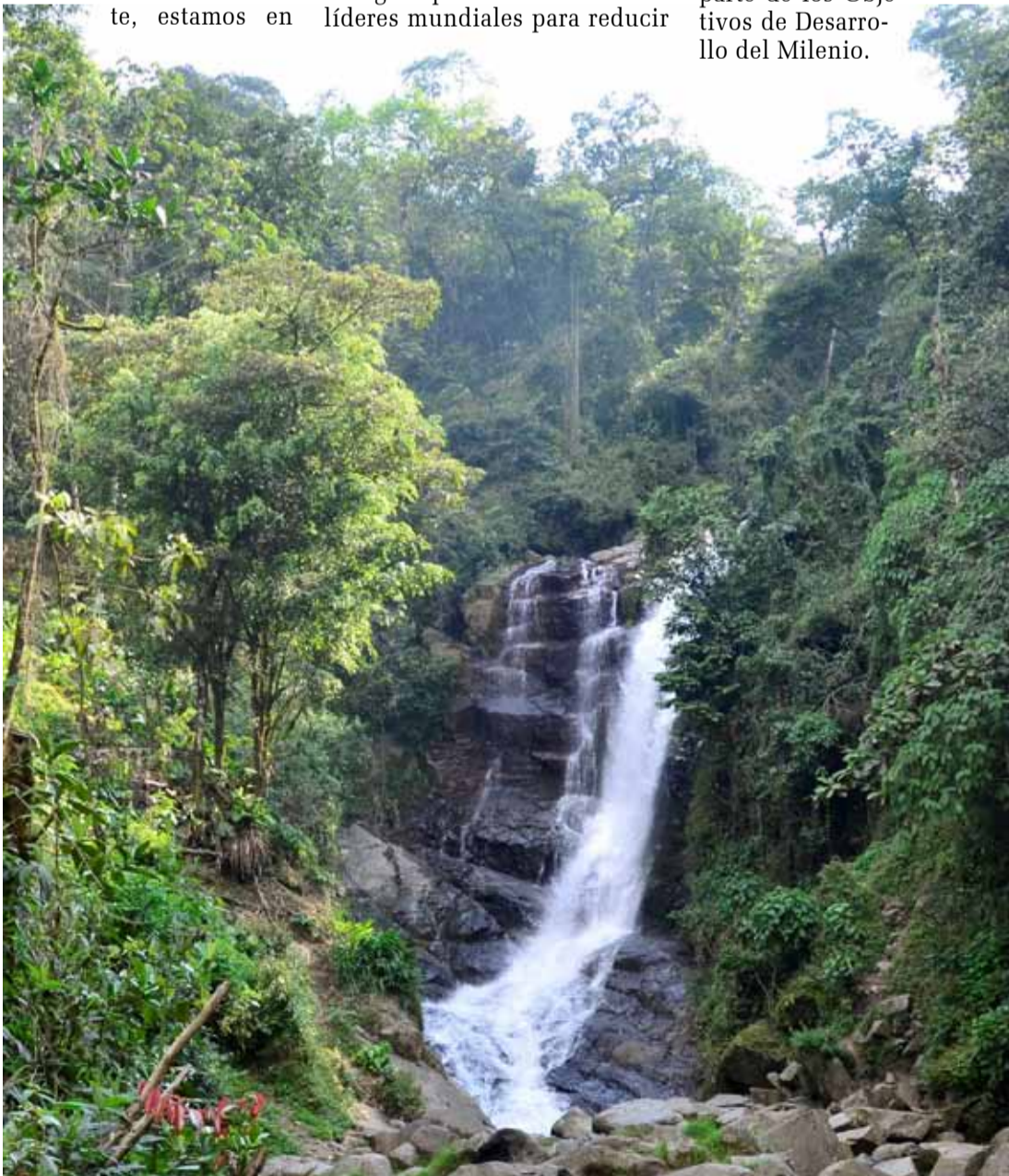
De acuerdo con un archivo actualizado de la Red Hídrica de Medellín, con fecha 2011, de la Alcaldía de Medellín, en el territorio de Santa Elena nacen aproximadamente 117 fuentes de agua que tributan al Río Medellín unas y a las cuencas del Oriente, otras.

a la mitad el porcentaje de la población mundial sin acceso seguro al agua potable y como parte de los Objetivos de Desarrollo del Milenio.