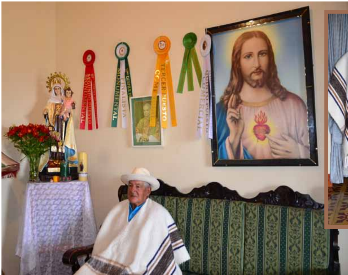
“Cuando se desarrolló la parte central había mucho entusiasmo. Íbamos de todas las veredas, los lunes, a hacer bloquitos de arena y cemento. Así se construyeron lo que fue el liceo, donde hoy está Mercandú, la cooperativa, el alcantarillado y el corredor de la Casa Cural”.