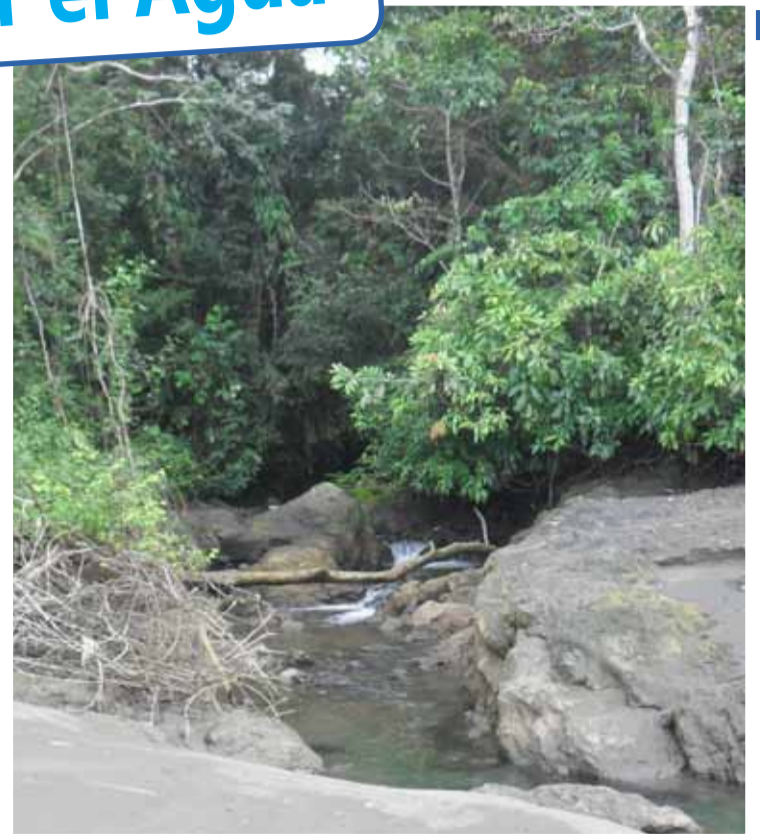
El agua del planeta se agota y lo triste es que es el hombre, con sus actitudes depredadoras, quien está acabando con este recurso limitado.