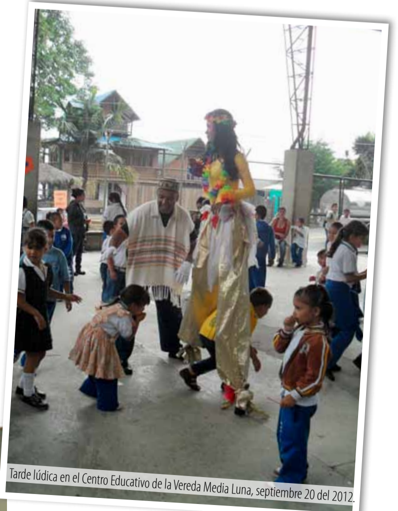
Tarde lúdica en el Centro Educativo de la Vereda Media Luna, septiembre 20 del 2012.