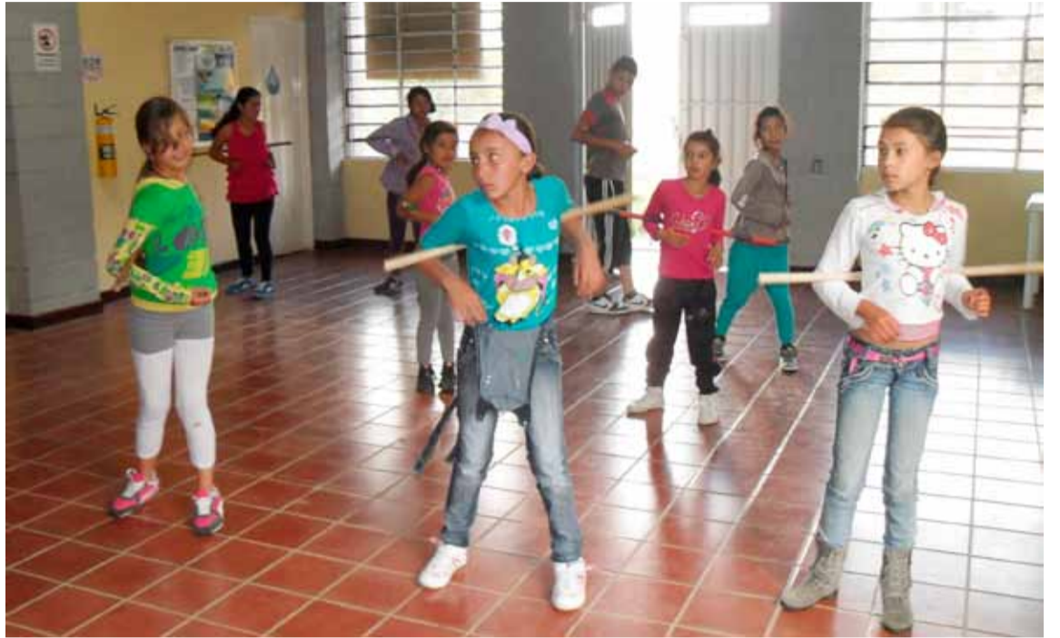
Niñas de la Vereda Mazo, en clase. Grupo nuevo de danzas, llamado Santa Ana de Mazo.

De igual forma, las chicas, entre los 8 y los 12 años, de la Vereda Mazo, acostumbradas tal vez sólo al regaetton y que hoy, como todas unas expertas, bailan porro chocoano, respiran danza folclórica y sonríen al ver sus propios avances con varias horas de clase. Grupo nuevo, antes inexistente, que hoy reclama su derecho a llamarse grupo de danzas Santa Ana de Mazo, en honor a la parroquia más antigua de Santa Elena, que lleva el mismo nombre y que está en su vereda. Sonrisas, entusiasmo, querer más, volver y traer a otros, son sólo actitudes de quien entiende que la cultura es más que bailar una tarde de sábado. Ellos no lo saben aún, pero muy seguramente, cuando estén mayores, estos niños entenderán que lo que se hizo con esos recursos públicos, priorizados alguna vez por la comunidad de su corregimiento, fue “picarlos” con el gusanito de la cultura y entusiasmarlos con procesos de dinamización local desde actividades tan agradables como com-