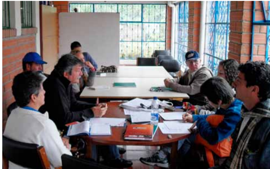
Reunión de la Mesa de Comunicaciones de febrero 20 del 2011.