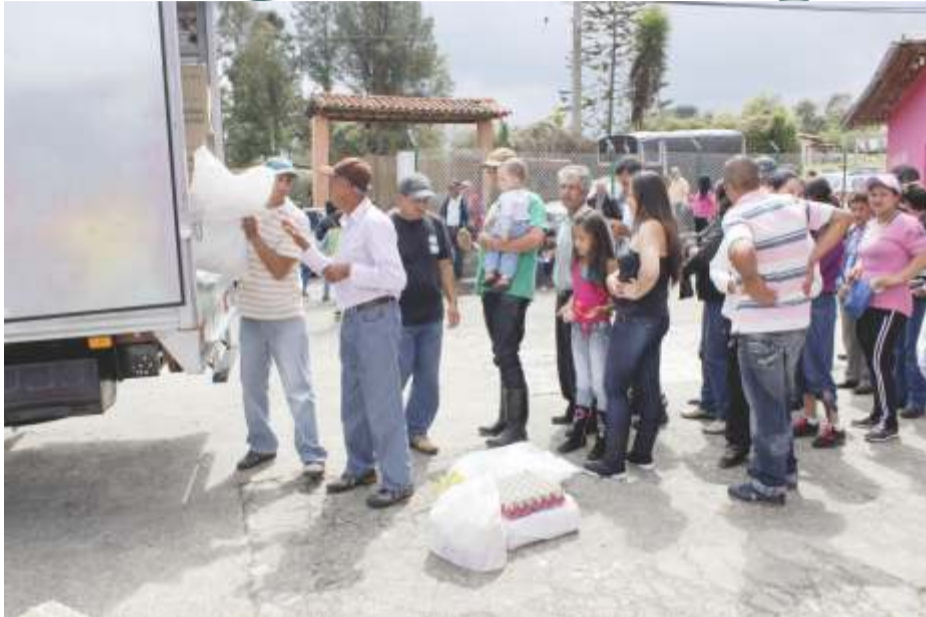
Imagen del 3 de noviembre, cuando la Administración Municipal entregó las primeras ayudas en la sede comunal de la Vereda El Plan.

Pareció otro paraje, otra ciudad, otro continente. Las fotos bien hubieran podido ser tomadas en cualquier lugar remoto de Europa. Pero por el contrario se configuraba la tragedia de 191 familias del Corregimiento de Santa Elena, Medellín, Colombia. Una granizada el 29 de octubre pasado los dejó, prácticamente, con lo que tenían puesto