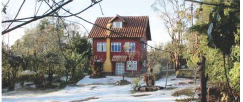
La evidencia del granizo. En la tarde del 29 de octubre, varios de los habitantes del corregimiento habían subido a Facebook las fotos de la intensa granizada.

La Administración Municipal, por medio de la Subsecretaría de