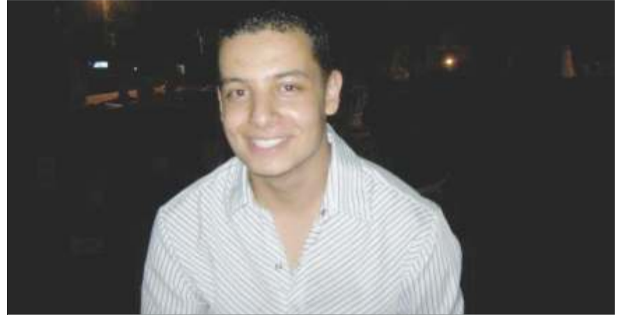
Nota y foto cortesía de la Organización VID - Congregación Mariana.

I ngresó a la Organización VID - Congregación Mariana como estudiante de práctica en el Departamento de Sistemas, en el segundo semestre del año 2010, proveniente del Tecnológico de Antioquia. Se desempeñó con tal calidad humana, espíritu de servicio, responsabilidad y amor a su trabajo, que una vez concluida esta etapa de su formación fue vinculado como colaborador en el cargo de Auxiliar de Sistemas (enero de 2011). En febrero de 2012 es promocionado al cargo de Programador de Sistemas, destacándose como esa persona digna de imitar a pesar de su juventud. Cariñosamente lo llamábamos "Pequeño Juan" evocando en la novela Robin Hood a su compañero monje llamado así y que sobresalía por su gran estatura. Sus compañeros lo recordamos con un inmenso cariño y como muestra de ello algunas de nuestras apreciaciones son: