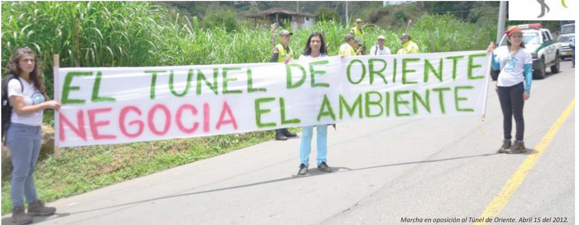
Marcha en oposición al Túnel de Oriente. Abril 15 del 2012.

Ordenanza 30 del 2010, mediante la cual se había autorizado a la Gobernación de Antioquia asignar recursos para cofinanciar el Túnel de Oriente, recursos que en su momento (2010) permitieron el cierre financiero (garantía de la totalidad de los recursos para su ejecución) del proyecto.