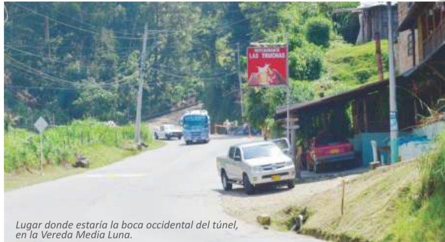
Lugar donde estaría la boca occidental del túnel, en la Vereda Media Luna.

- Falsedad ideológica en documento Público: Servidor público que consigne una falsedad en un documento público o calle total o parcialmente la verdad.