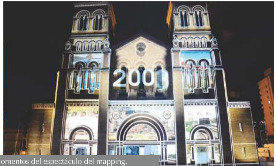
Diferentes momentos del espectáculo del mapping.