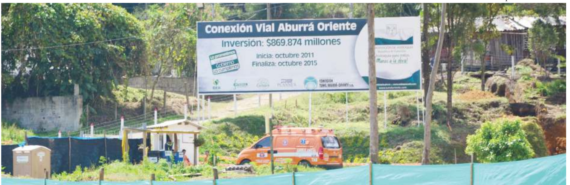
Hoy el proyecto no tiene piso financiero. Con la nulidad de la ordenanza que le garantizaba los recursos al proyecto, queda en vilo la ejecución del túnel. La Gobernación habla de valorización aplicada a algunos municipios del Oriente. Los alcaldes se niegan con el argumento de la autonomía municipal y el costo-beneficio.