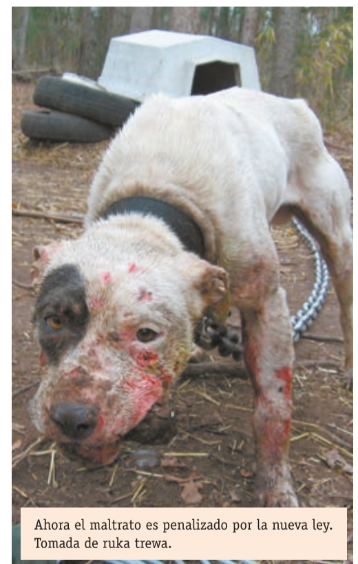
Ahora el maltrato es penalizado por la nueva ley.

Las denuncias son recibidas por la Secretaría de Medio Ambiente, a través de la Inspección Ambiental, que cuenta con líneas de atención al ciudadano y redes sociales como Facebook. Quien desee hacer una denuncia también puede comunicarse con el 123.