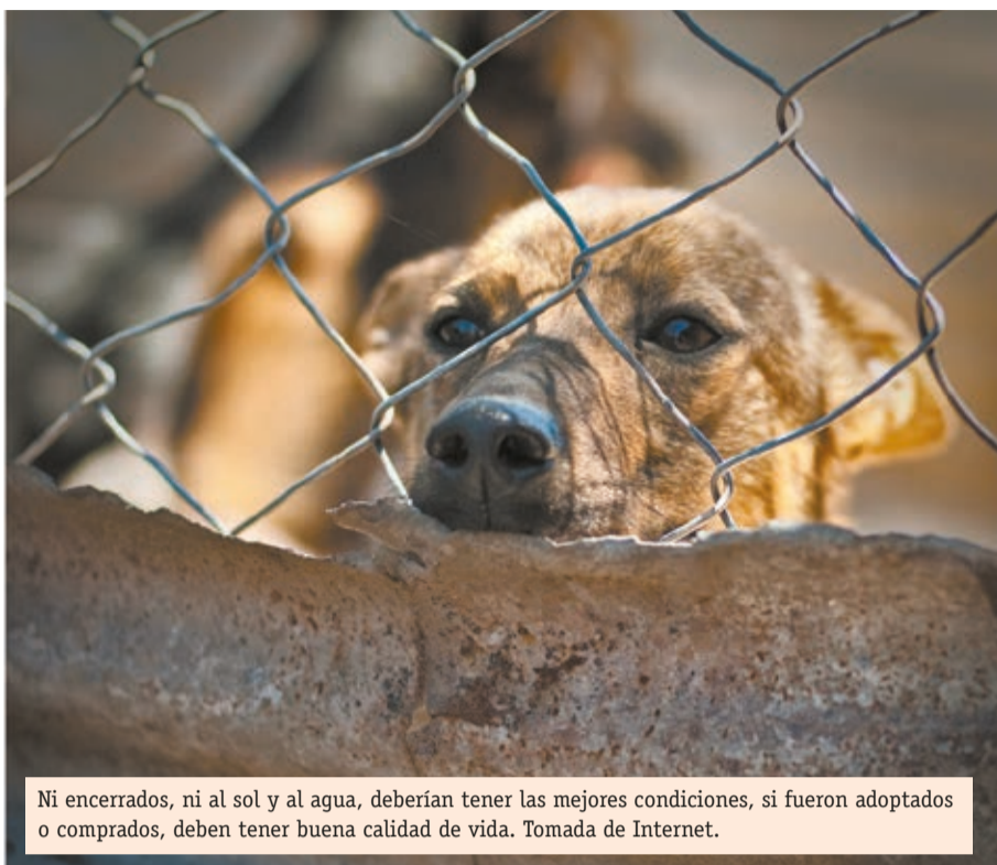
Ni encerrados, ni al sol y al agua, deberían tener las mejores condiciones, si fueron adoptados o comprados, deben tener buena calidad de vida.