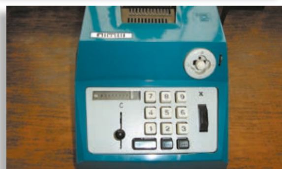
Fotos tomadas de internet y sólo para ilustrar la nota, no corresponden ni a la sumadora ni al cuadro del Sagrado Corazón de Jesús de la época.