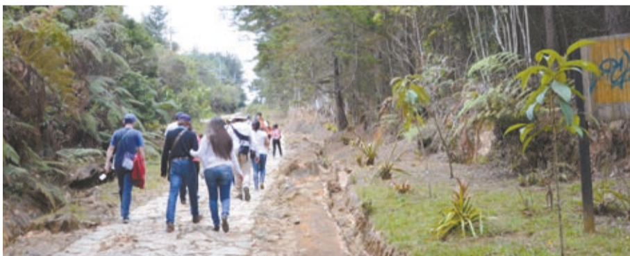
Preservar el territorio es uno de los más claros objetivos de la Red Turística Santa Elena.

La Red está conformada hoy por los subsectores de Artesanos, Alojamientos, Gastronomía, Operadores Turísticos y Guías, Movilidad, Agropecuario, Comerciantes, Cultura Silletera, Cultura, Ferias-eventos y Muestras Empresariales - , Comunidad y Comunicaciones, con un total de casi 200 empresarios.