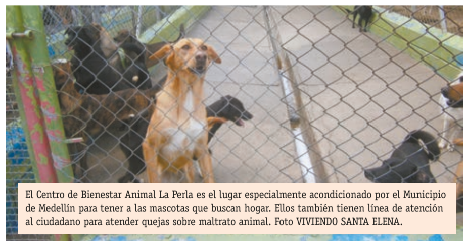
El Centro de Bienestar Animal La Perla es el lugar especialmente acondicionado por el Municipio de Medellín para tener a las mascotas que buscan hogar. Ellos también tienen línea de atención al ciudadano para atender quejas sobre maltrato animal.

Quien a pesar de saber que existe una ley que penaliza el maltrato animal cometa estos actos, incurrirá en penas de prisión que van de 12 a 36 meses, multas entre 5 y 60 salarios mínimos legales mensuales vigentes e inhabilidad especial de 1 a 3 años para el ejercicio de profesión, oficio, comercio o tenencia que tenga relación con animales.