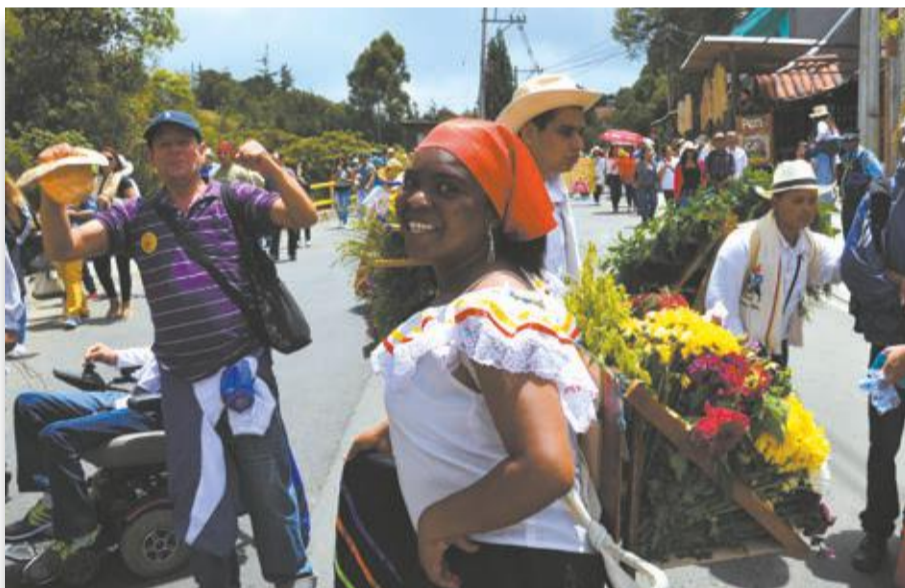
El grupo de Discapacidad del corregimiento, muy animados.