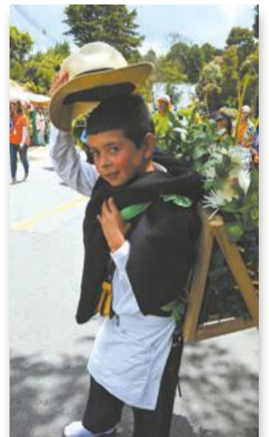
Y sólo es decirle 'vuelta' y ya lo hace con sonrisa y levantada de sombrero. Hermosa tradición.