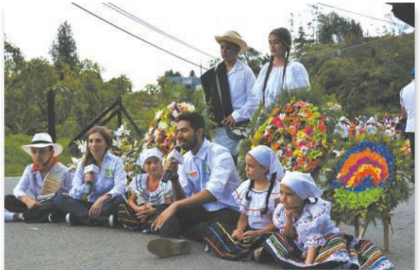
Teleantioquia y Teled Medellín en su transmisión conjunta del desfile y los protagonistas del día, silleteritos de todas las edades.