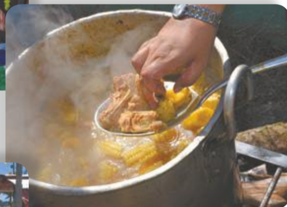
Tempranito, corriéndole a la carne pa’ que quede blandita.