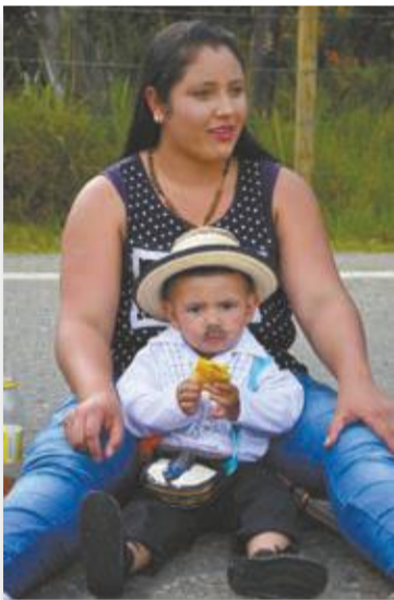
No hubo forma de hacerlo sonreír. Lindo bigote, pero antes que la foto, era más importante el pastel de pollo antes de salir a desfilan.

Este año participaron 570 niños, niñas y jóvenes de todas las veredas, entre los cuales hubo 46 bebés en coches decorados hermosamente. Aquí les mostramos lo mejor de una de las actividades más tradicionales de la Feria en Santa Elena.