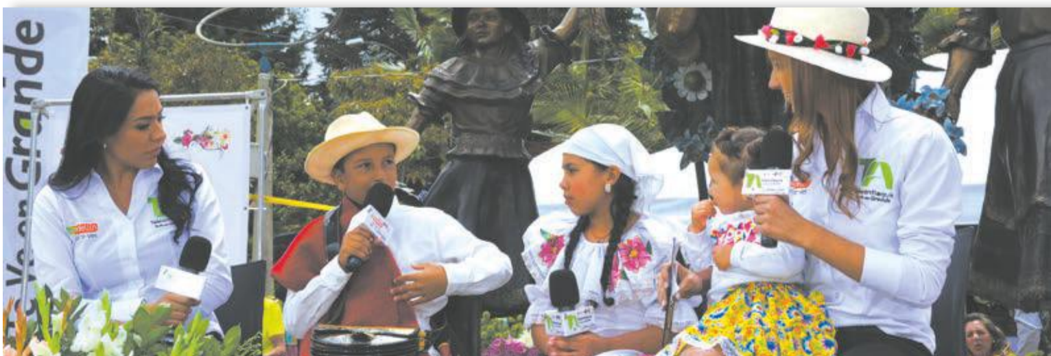
Y estos niños, los más famosos, en plena transmisión, acompañando el contexto del desfile.