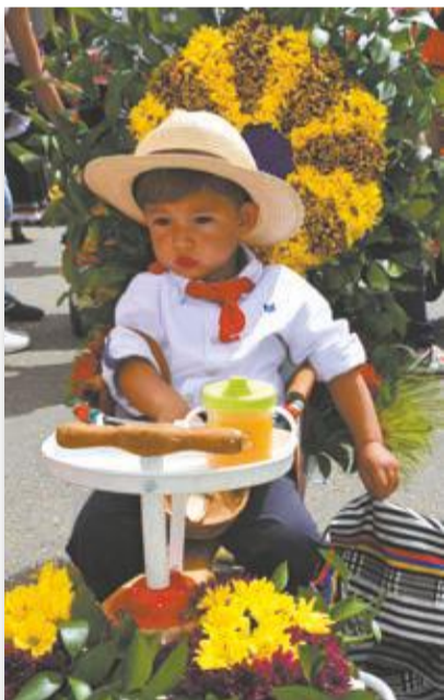
Un poquito de sueño, nada más.