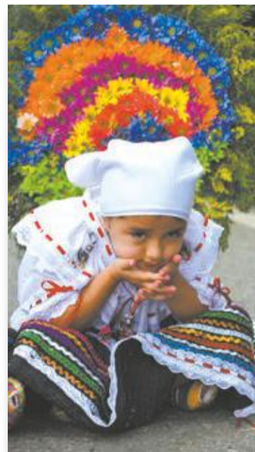
¿Qué podrá estar pensando ella, mientras sus compañeritos de 'set' responden a las preguntas de los presentadores de los canales regional y local?