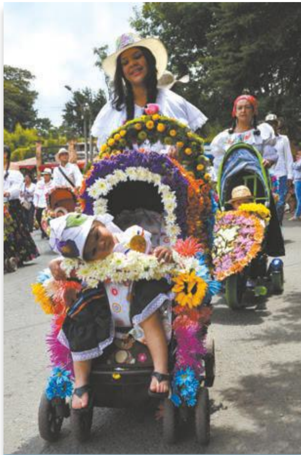
Me duermo, no me duermo... mejor me recuesto aquí, al fin y al cabo, mi mamá es la que me lleva.