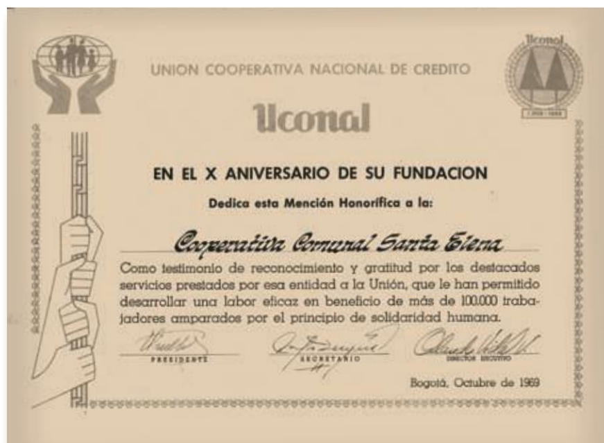
Imagen del reconocimiento que hizo Uconal a la Cooperativa en 1969