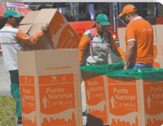
Ellos siempre activos, nunca faltan y son los que garantizan que el corregimiento se vea impecable, a pesar de las toneladas de basura que se producen durante las fiestas.