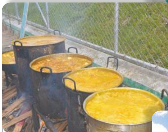
Como de sobra, el sancocho. Esto era de un solo puesto. Se sabe que no se vendió todo.