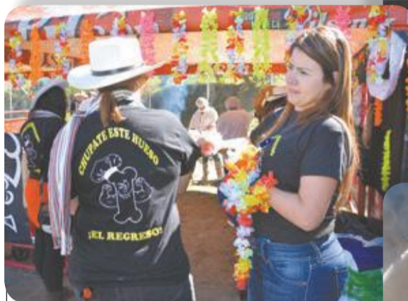
Lista la decoración. Y estos ganaron, otra vez., primer puesto este año.