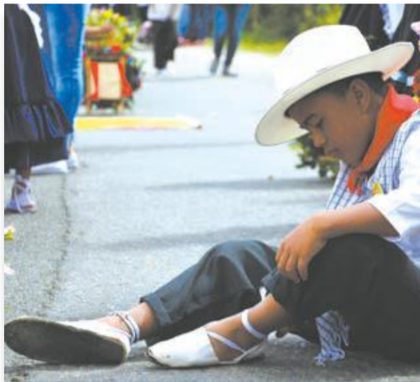
Mientras el desfile empieza, a ver yo veo cómo me amarro esto.