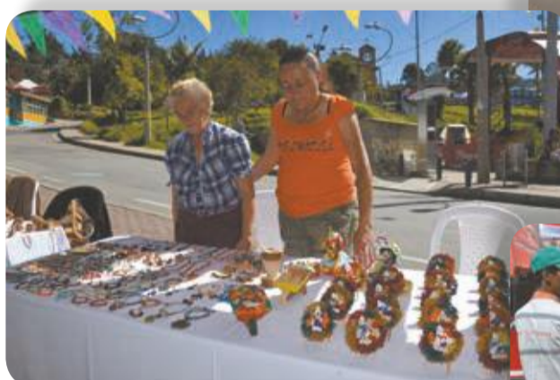
Los artesanos, listos. Muchos se quedaron con la mercancía lista.