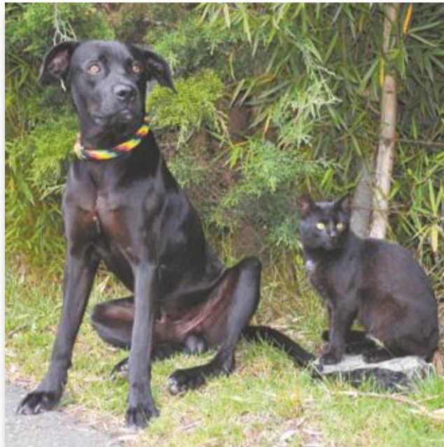
Un par de espectadores inusuales. Llamaron la atención por su color, pero además porque andan juntos. Una bella estampa y el punto diferente de un colorido desfile.