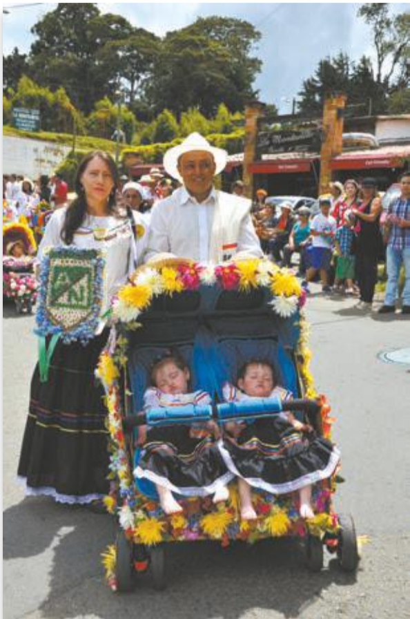
Doble tanda y no alcanzaron a arrancar el desfile para dormirse.