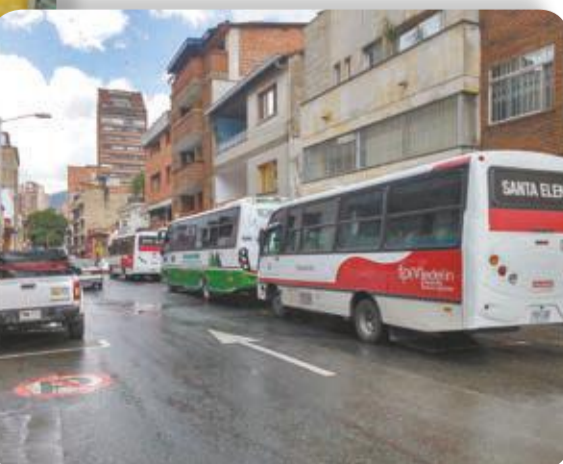
El transporte, otro damnificado. A la 1:45 de la tarde, este era el panorama en el centro, en el cuadradero. Siete busetas esperaban por la afluencia masiva, pero a esa hora, ya el que no subió, no subió.