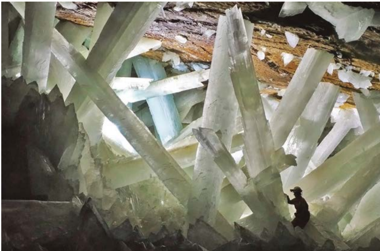
Suficiente evidencia hay de que es santaelenense. Para muestra adicional, la bella imagen del mineral llamado selenita. Imagen tomada de Internet de la Cueva de Naica, en el estado de Chihuahua en México, donde está uno de los yacimientos más grandes de selenita.