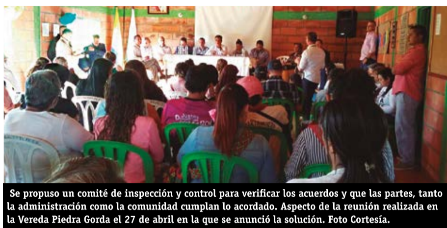
Se propuso un comité de inspección y control para verificar los acuerdos y que las partes, tanto la administración como la comunidad cumplan lo acordado. Aspecto de la reunión realizada en la Vereda Piedra Gorda el 27 de abril en la que se anunció la solución.