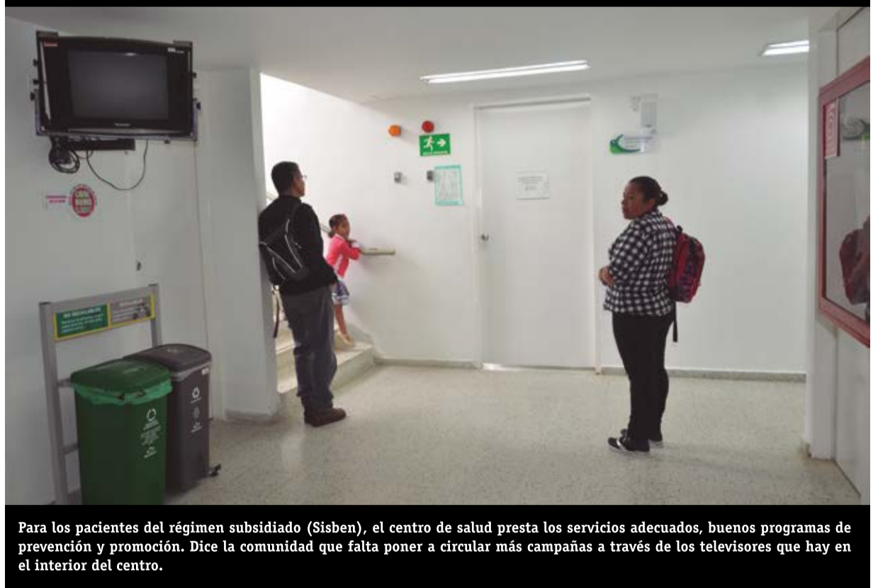
Para los pacientes del régimen subsidiado (Sisben), el centro de salud presta los servicios adecuados, buenos programas de prevención y promoción. Dice la comunidad que falta poner a circular más campañas a través de los televisores que hay en el interior del centro.

imposible la atención de una emergencia, o algo que sea de vida o muerte. Quien así llegue, no debe perder tiempo y correr a San Vicente Fundación o Somer, en Rionegro o las clínicas ubicadas en el centro de Medellín.