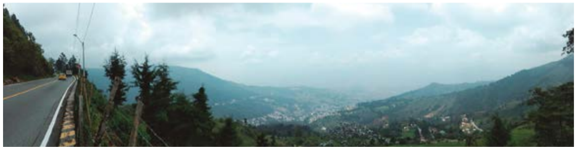
Captada desde Santa Elena, el 25 de marzo, tercer día de la alerta roja. No es la cara del invierno, realmente era la carga contaminante que soporta la ciudad.

Puede que Medellín no haya llegado a niveles tan extremos de contaminación como Ciudad de México o Santiago de Chile. Sin embargo, nuestra ciudad cuenta la triste historia de dos emergencias ambientales, una en el 2016 y otra de nuevo en marzo de 2017, ésta última con alerta roja incluida. Aunque se crea que se trata de un fenómeno inofensivo, sus efectos pueden ser letales. Lo peor, son invisibles y silenciosos.