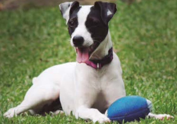
Pola fue asesinada con 1 tiro, en vereda Piedras Blancas-Guarne 28/03/2017.

Niveles de crueldad inimaginables con las mascotas parece ser el triste panorama de Santa Elena. A pesar de la existencia de la Ley de Maltrato Animal y sus severas penas, los actos de crueldad contra las mascotas continúan en el corregimiento y hacen pensar que Santa Elena no es un buen lugar para los peludos.