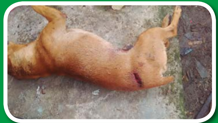
Tomás, perro encontrado muerto en la Vereda El Plan, el 22 de marzo. Tenía una herida profunda con un machete.

Línea de atención a la ciudadanía Centro de Bienestar Animal La Perla: 342 02 75 - 342 04 13