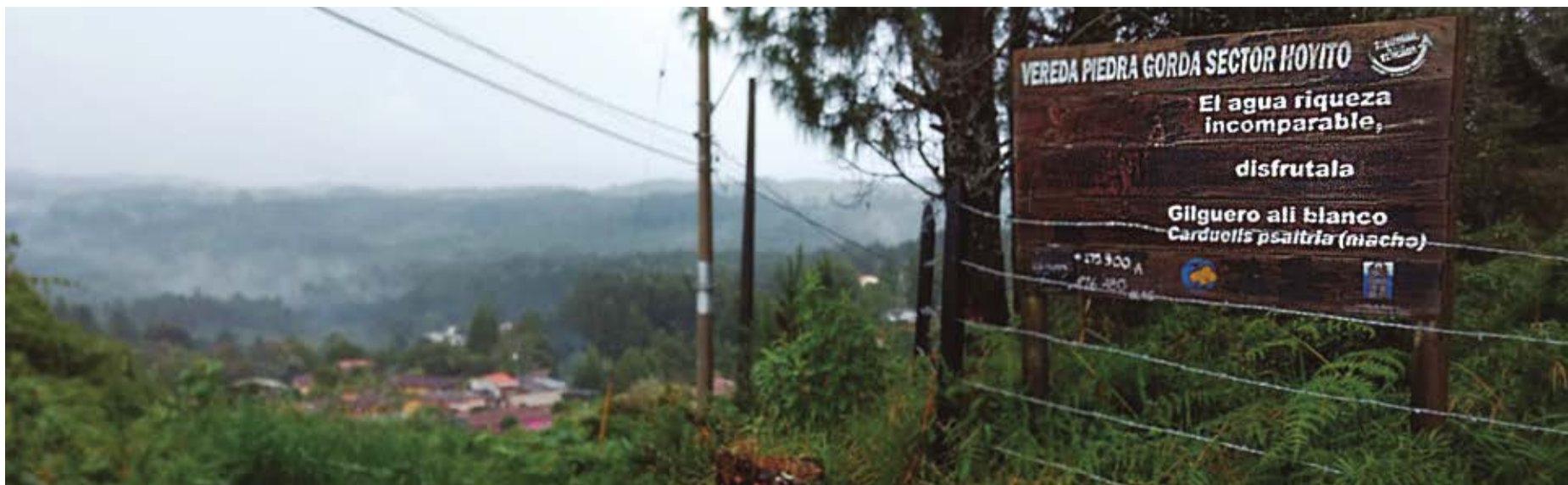
Aspecto de la Vereda Piedra Gorda, patrimonio de Santa Elena.