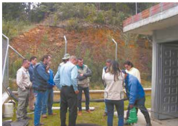
Corantioquia preguntó por el Plan de Emergencia y Contingencia, que debe existir para mitigar los impactos en caso de una emergencia. El acueducto indicó que tiene un plazo de dos meses para presentarlo ante la Superintendencia de Servicios Públicos.