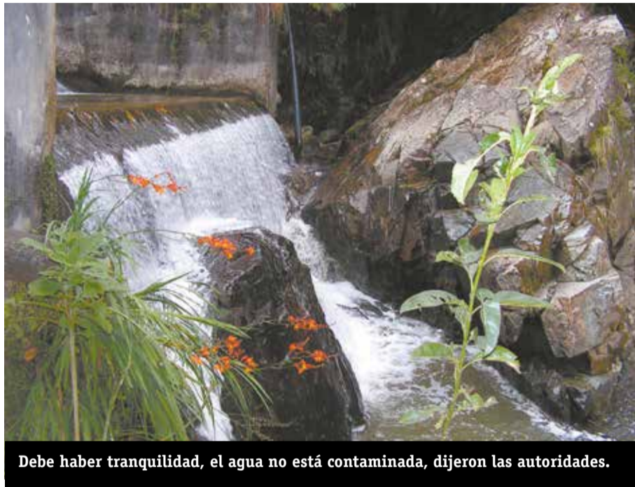
Debe haber tranquilidad, el agua no está contaminada, dijeron las autoridades.

Para explicar mejor, EL AGUA QUE RECIBEN los usuarios como beneficiarios del ACUEDUCTO y entra a las casas y negocios, NO ES LA MISMA CANTIDAD que sale hacia el ALCANTARILLADO, para tratamiento. Hay dos razones fundamentales: Punto uno, el alcantarillado está diseñado para recibir 2 litros de agua por segundo, pero está recibiendo 10 litros, lo cual, por lógica, ha generado un trabajo adicional de las máquinas de bombeo. En esas condiciones, se quemó una, entró en funcionamiento la otra de reemplazo, que también se quemó y llegó una tercera que es la que está funcionando. Desafortunadamente, aunque las pólizas por la construcción del sistema son por 5 años y están aún vigentes, la garantía de las bombas ya se había vencido cuando se dañaron. Con las dos bombas fuera de circulación, al colapsar, la única opción es arrojar los residuos a la quebrada, sobre lo cual los expertos dijeron “que es preferible arrojar a la quebrada durante la contingencia y trabajar para superarla que soportar la devolución de los residuos hacia las tuberías de las casas, que es más grave”.