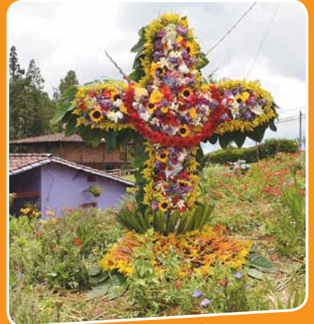
Casa de Leopoldina Alzate, Vereda Piedra Gorda.

Participaron en total 47 cruces de todos los rincones del corregimiento. Aquí les mostramos algunas de las más bonitas y representativas.