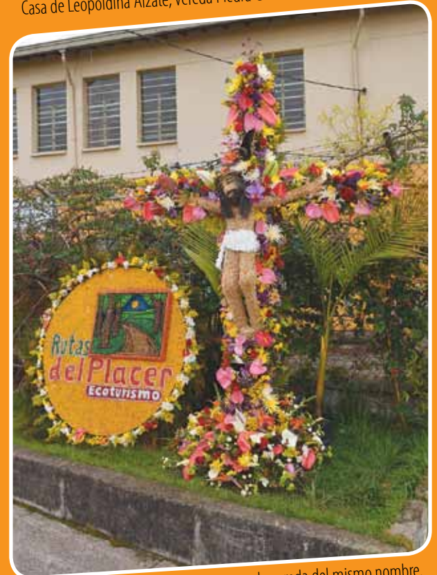
La cruz elaborada por Rutas del Placer, en la vereda del mismo nombre.