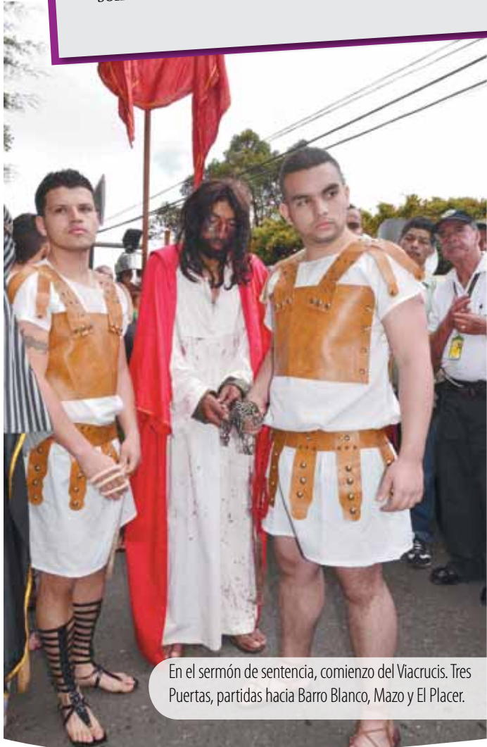
En el sermón de sentencia, comienzo del Viacrucis. Tres Puertas, partidas hacia Barro Blanco, Mazo y El Placer.