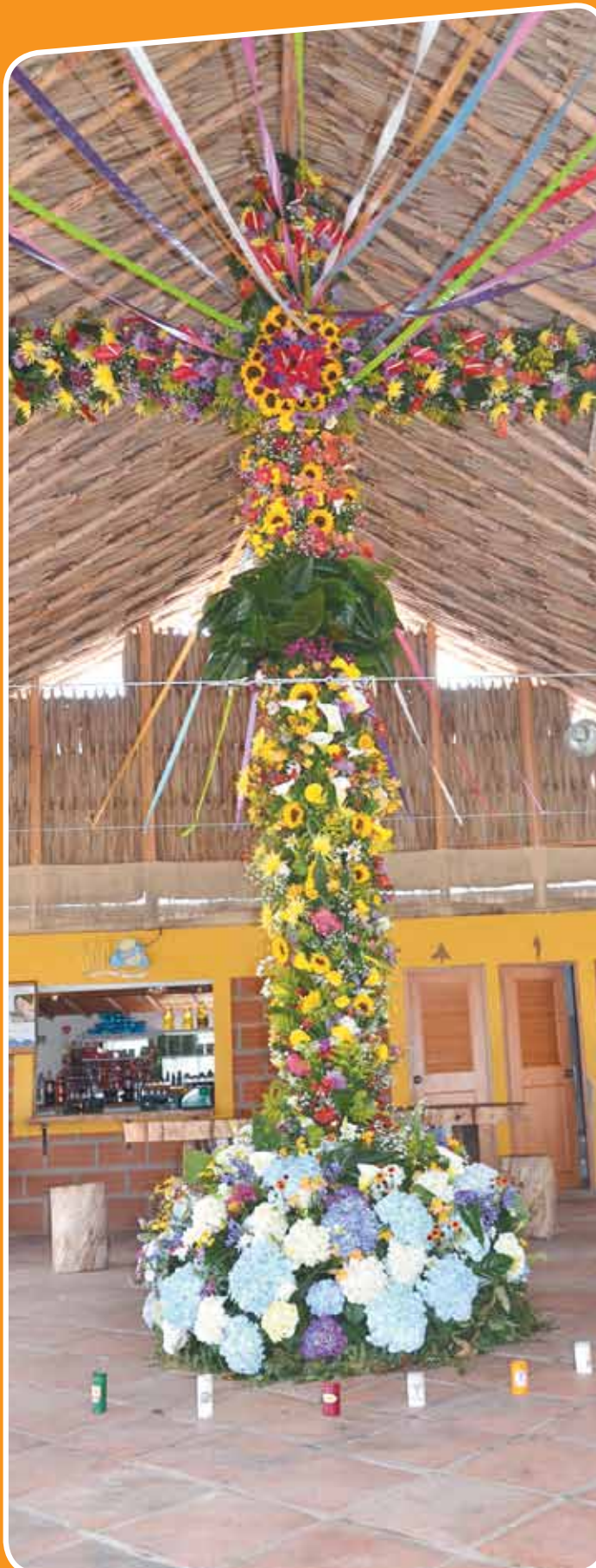
Rancho Palapa, Vereda Mazo.