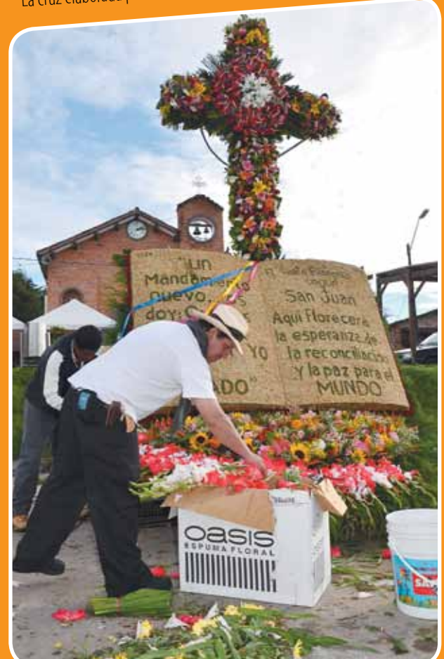
Mucho madrugaron el Viernes Santo los integrantes de la Corporación Internacional de Silleteros a concluir los detalles de la cruz ubicada en la parte central.