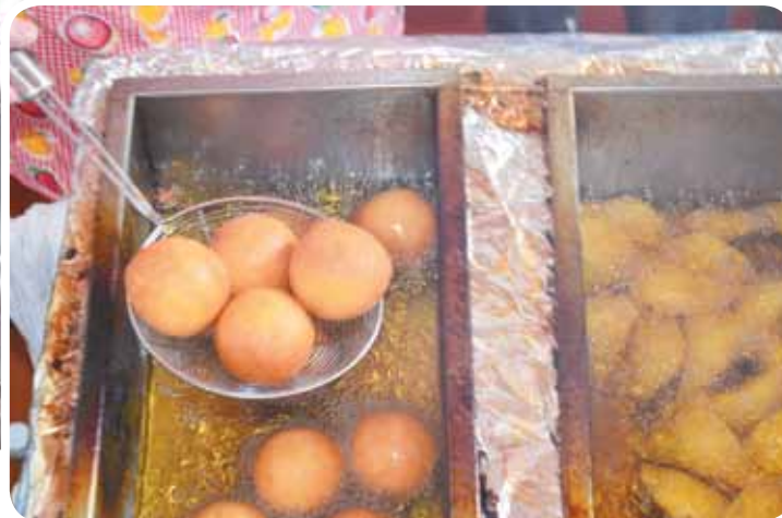
La preparación, muy importante.

Un párrafo aparte se merece el ají y es que como dijo un cliente: “debemos partir hablando de él”, siendo algo picante pero muy delicado, actúa como alfabetizador de paladares dulzones, siendo el perfecto acompañante de todo, y todo es todo, ya que algunos osados, los he visto, se lo echan hasta a los buñuelos.