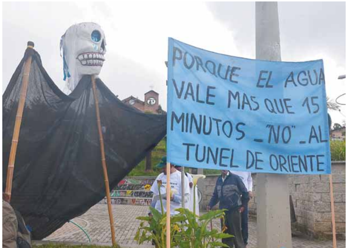
Aspectos de la Caminata por el Derecho al Agua, realizada por el Comité Cívico Ambiental el pasado 15 de abril. Los asistentes salieron desde el parque principal de Santa Elena y desde Barrios de Jesús y se encontraron en la Cascada (Bocaná).

Una de las solicitudes fue para que se inicie proceso sancionatorio por la violación a la Zona Forestal Protectora del Río Nare, con el proyecto Túnel de Oriente. Explican los demandantes que “Tanto el proyecto licenciado mediante Resolución Cornare 1764 de 2002 como el proyecto descrito en el documento de ajuste del Estudio de Impacto Ambiental y acogido por la Resolución Cornare 112-0741 del 15 de febrero de 2010, atraviesan el área de reserva forestal protectora nacional del Río Nare (...)”.