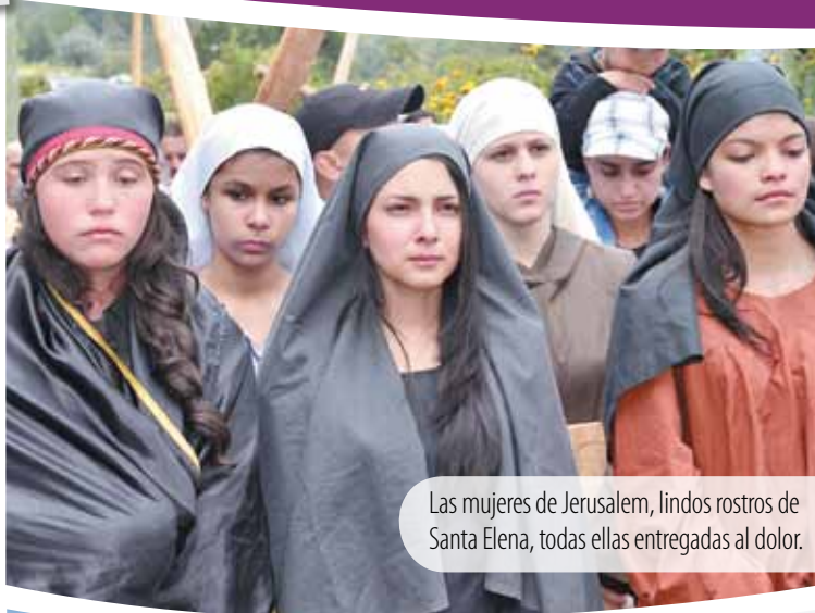
Las mujeres de Jerusalem, lindos rostros de Santa Elena, todas ellas entregadas al dolor.