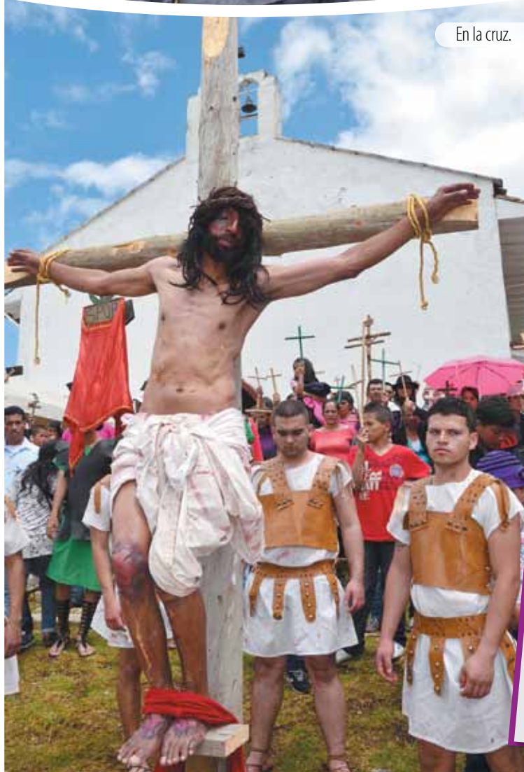
En la cruz.