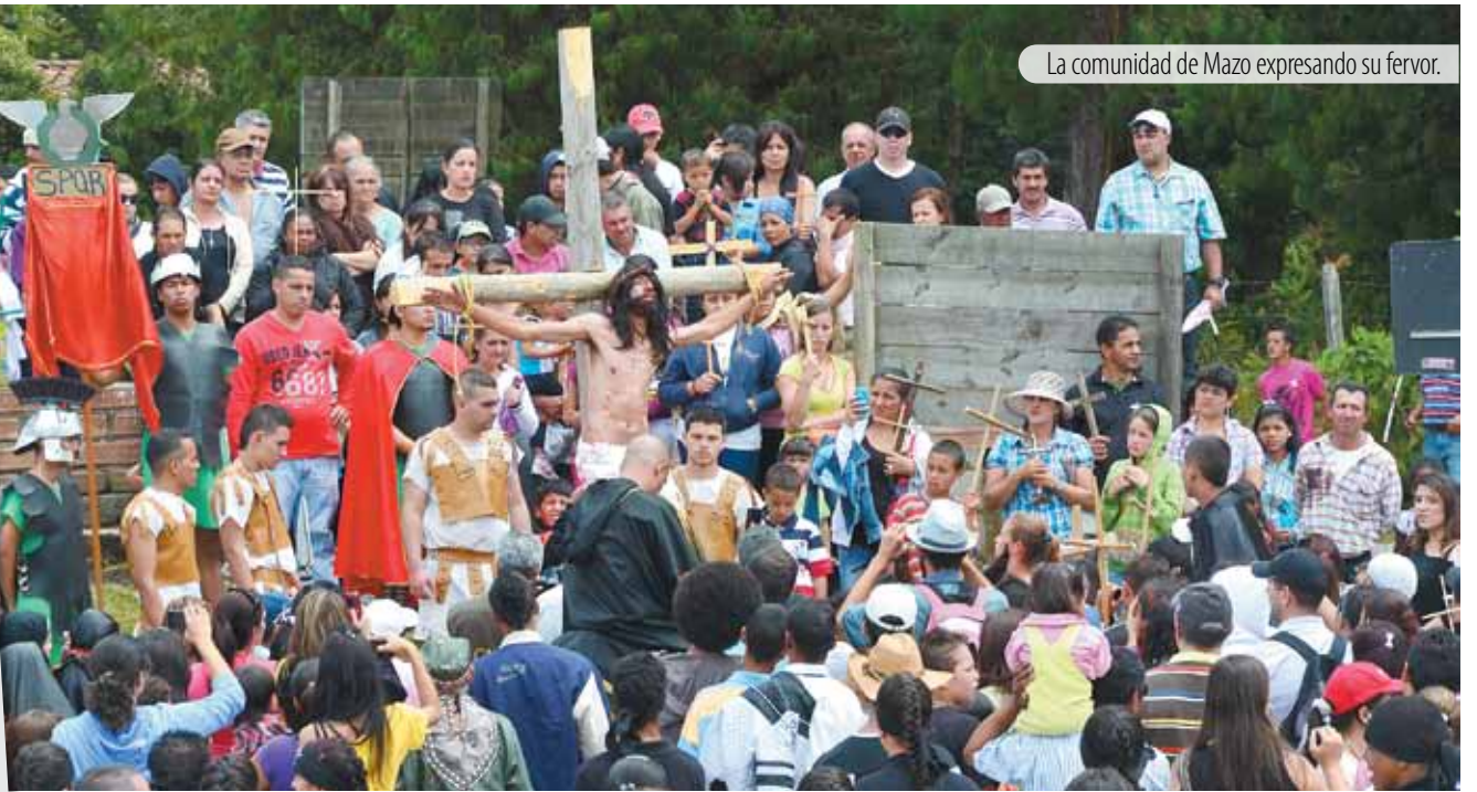
La comunidad de Mazo expresando su fervor.