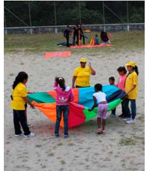
Los más chicos gozaron con las actividades del Inder.