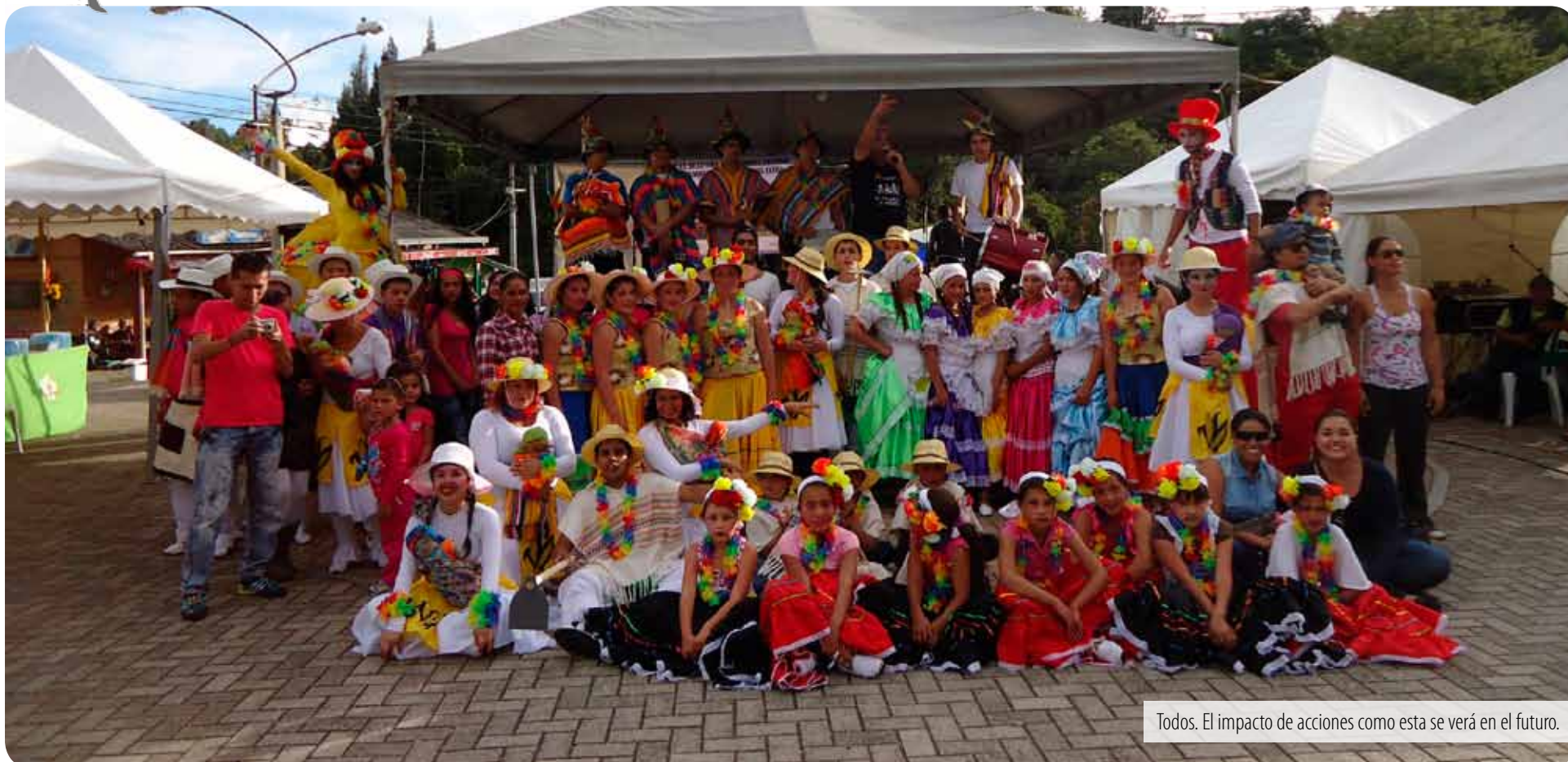
Todos. El impacto de acciones como esta se verá en el futuro.