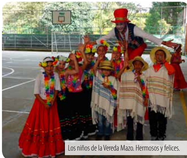
Los niños de la Vereda Mazo. Hermosos y felices.