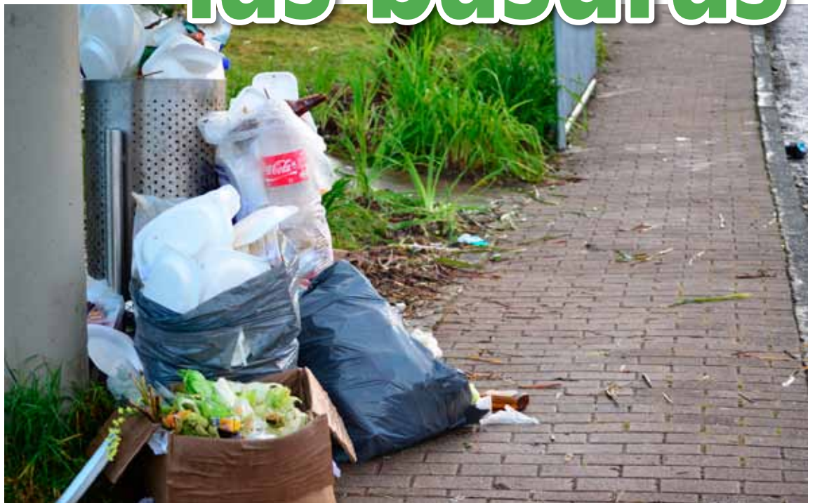
La foto corresponde a uno de los tantos días de la Feria de las Flores 2012, agosto 5. Y nótese la mala disposición con residuos a la vista y abiertos que los perros terminan de regar.

Los que vivimos en Santa Elena, disponemos del servicio del camión recolector y de centros de acopio para la recolección de basuras. Cuando notemos que el servicio se torna deficiente, es nuestro deber informar y re-