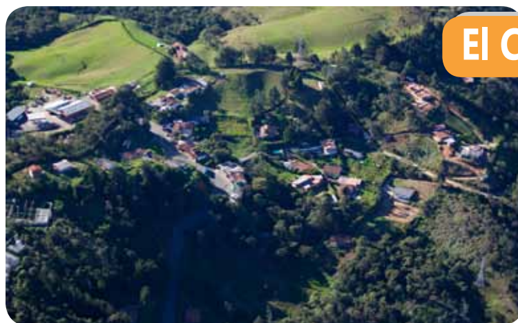
Una revisión minuciosa de los Planes de Ordenamiento de los corregimientos y mejoramiento en temas de salud, pidieron los concejales para los corregimientos. La foto es del proceso del Plan Especial de Ordenamiento Corregimental de Santa Elena, en su etapa de diagnóstico, en el 2010. Es una imagen aérea del sector de Las Brisas y la entrada a la Vereda San Ignacio.