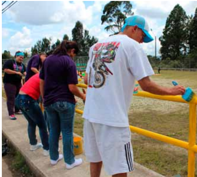
Nótese el juicio de estos jóvenes quienes dedicaron su domingo a embellecer la vereda.

el joven presidente de la Junta de Acción Comunal de Piedra Gorda, actividad similar no se hacía desde hace unos 2 años y la idea era atender varios frentes para evitar que el descuido se tomara la vereda. Hubo actividades recreativas para los niños y en la noche un festejo cultural para los adultos.