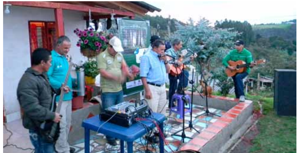
La foto fue tomada en la más reciente jornada de Relatos Arví, en el sector Los Vásquez de la Vereda Mazo.

Relatos Arví quiere que todas estas historias fuera de ser proyectadas en la televisión, queden plasmadas también en un libro para las generaciones futuras.