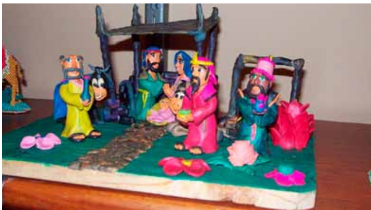
Pueden utilizarse pesebres como el de la foto, de plastilina. No sólo resultan ecológicos sino llamativos.