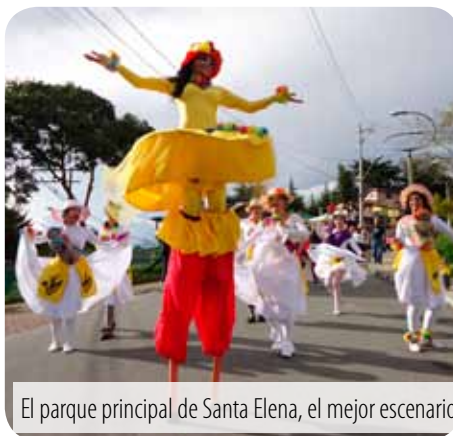
El parque principal de Santa Elena, el mejor escenario.

de 4 meses, fue lo que quedó de recursos del Presupuesto Participativo, pues no se priorizaron más propuestas para el 2013 en ese renglón. La ficha, por valor de 35 millones de pesos se ejecutó así: Valor estimado del convenio $40.159.871, aporte del Municipio de Medellín $31.500.000, aporte de la Corporación Barrio Comparsa $8.659.871.