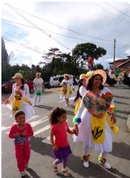
Los más chicos, pendientes de todo y no se perdieron ningún baile.

Todo un ritual a la cultura y justo ese día, hacían las honras fúnebres de otro cantante de hip hop de la Comuna 13, asesinado la noche anterior. El homenaje y, de nuevo, la petición del sector cultural, representado aquí por Barrio Comparsa, para que cese la guerra contra la cultura y que los artistas sean respetados.