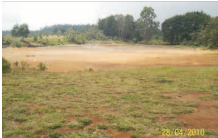
Abril 28. Seca del todo.

Las fotos, por fechas, muestran el proceso de llenado de la laguna.