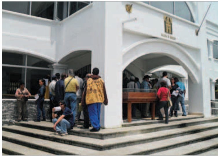
Las primeras filas.

rios y muchos de ellos tuvieron incongruencias en los documentos presentados (predial y servicios a nombre de diferen-