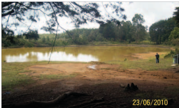
Junio 23. Mejor aspecto, ya parece laguna otra vez.