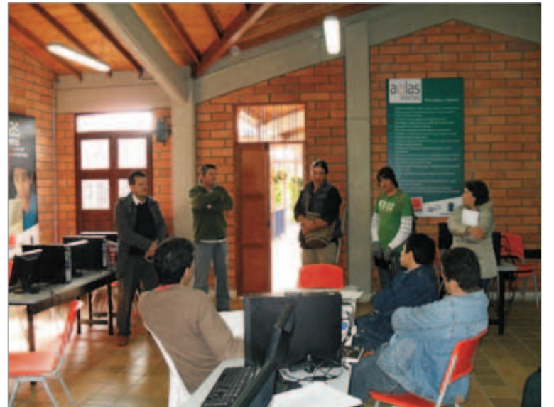
Algunos integrantes de la Mesa de Comunicaciones, el pasado 1º de octubre, acompañando el proceso de semillero de comunicaciones de la Institución Educativa de Santa Elena.