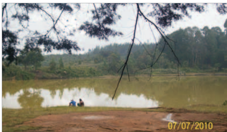
Julio 7. Como lo que era.