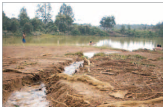
Septiembre 4. El canal que hicieron, evidente que le aporta mucha agua a la laguna.