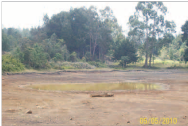
Mayo 5. Mejorando, despacio.