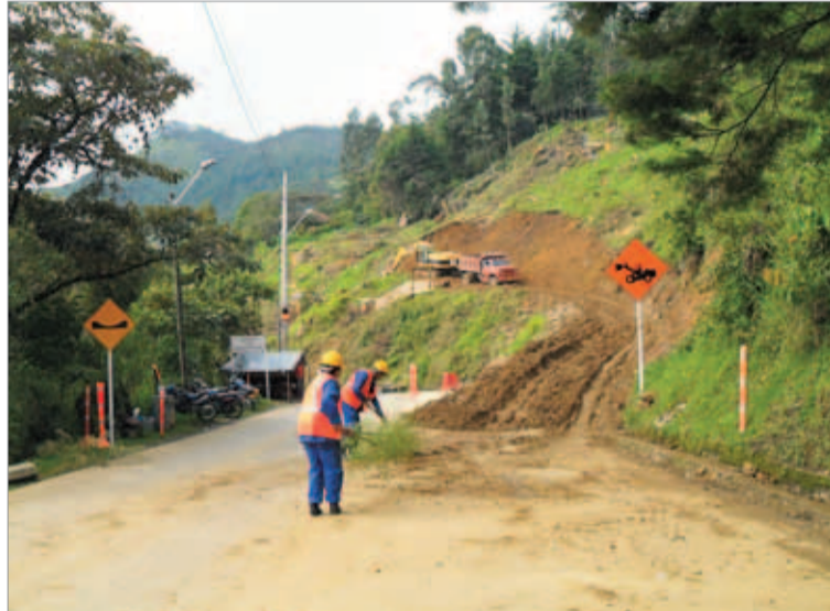
Cuando todavía no estaba cerrada la vía y la comunidad se preguntaba cuáles serían las obras que ejecutaría la Concesión.

Al final, la Concesión señaló que sólo se habían otorgado unos 800 permisos, pero quienes solicitaron el permiso, sabemos, fueron más de 3.000 usua-