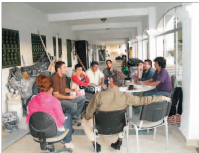
La Mesa de Comunicaciones se reúne cada 15 días y es responsable, por ejemplo, de procesos como el del programa de radio Ecos de Santa Elena.

Para mayor información, pueden comunicarse a mesacomunicacionessantaelena@gmail.com o a viviendosantaelena@une.net.co