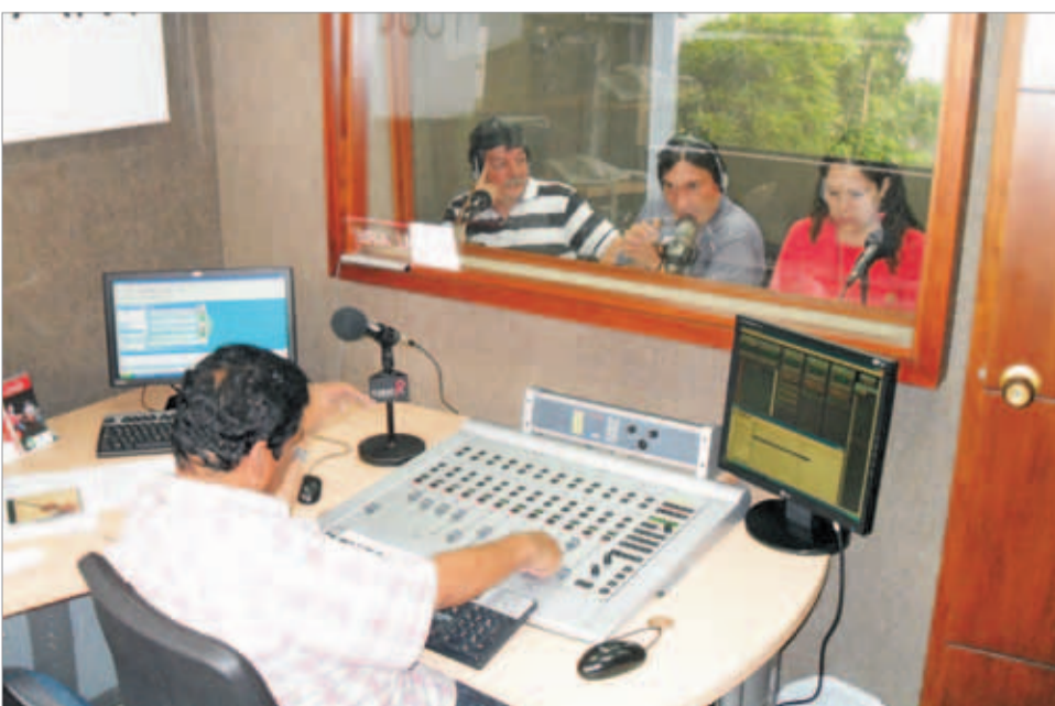
La gráfica muestra el último programa realizado de ECOS DE SANTA ELENA, el cual fue sobre el tema de movilidad y por el cual fue otorgado el premio.