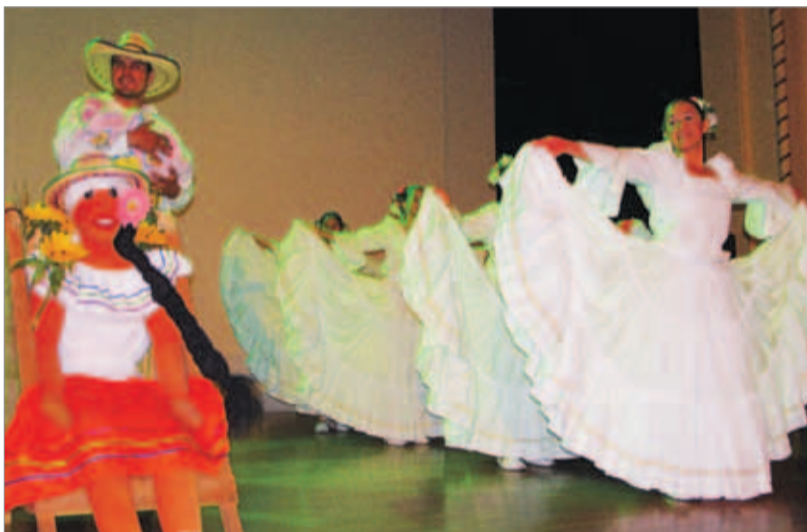
Aspectos del ensamble realizado el pasado 20 de noviembre en el Teatro Lido.