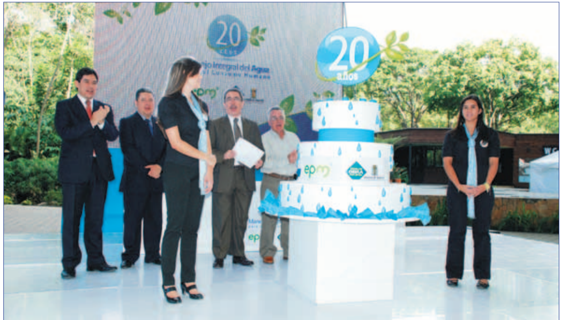
Celebración de los 20 años del programa.