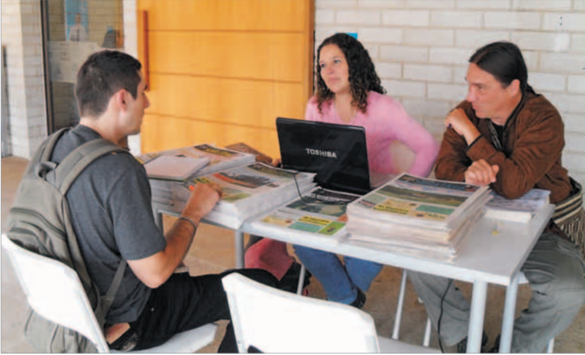
Asistencia de VIVIENDO SANTA ELENA al Encuentro de Medios Alternativos realizado por el Periódico El Taller, en el Parque Biblioteca de Belén, en septiembre del 2010.

En fotos les contamos un poco lo que fue este año de construcción de estos dos medios de comunicación comunitarios, el Programa Radial ECOS DE SANTA ELENA y el Periódico VIVIENDO SANTA ELENA. Esfuerzo, dedicación, compromiso, a veces desánimo, mucha fuerza y trabajo con las uñas, componen esta galería y aunque las fotos no lo muestren de manera explícita, mucha pasión para realizar el trabajo. También apoyo, muchos siempre estuvieron ahí, otros no creyeron, también intentos de censura desde la oficialidad, pero igual, el trabajo se hizo, con calidad, pensando en el beneficio para la comunidad. El proceso sólo tiene aciertos, muchos beneficios y una puerta para lo que viene.