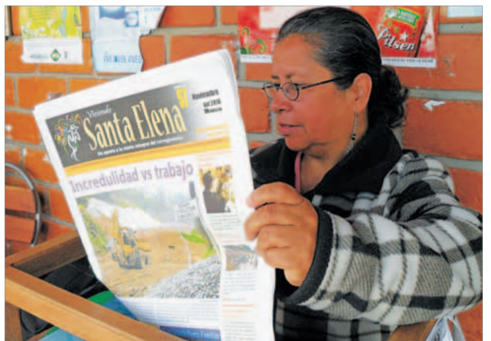
Acogida de VIVIENDO SANTA ELENA. Una vez empieza a circular, siempre se agota.