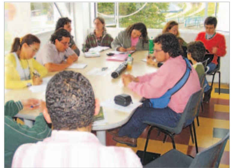
Reunión de la Mesa de Comunicaciones de Santa Elena en febrero 25 del 2010.