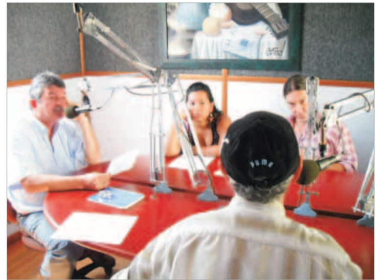
Grabación del programa piloto de radio el 29 de mayo del 2010. Empezaba la aventura.