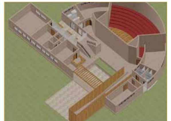
Imágenes de cómo quedará la nueva sede de la Escuela de Música, un lugar adaptado a sus necesidades y construido con todas las especificaciones técnicas y la acústica necesarias.