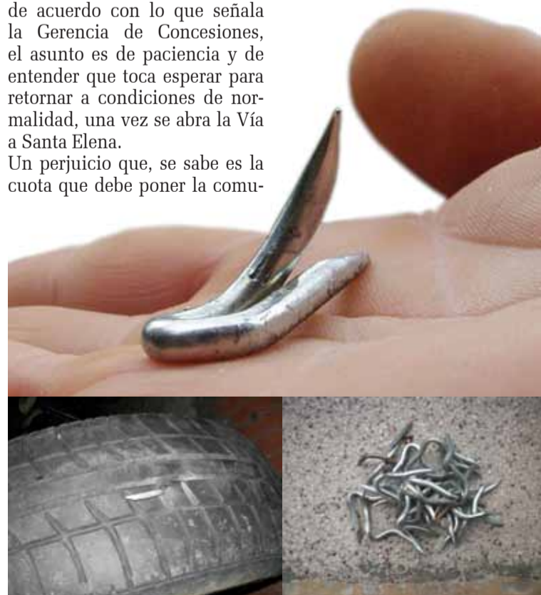
¿Beneficio general? Las tachuelas pusieron en jaque a más de uno.

*Nombres ficticios para proteger las identidades de quienes nos brindaron sus testimonios.