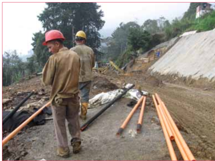
Para la contratación tuvieron en cuenta a las acciones comunales del sector, pero una de las fallas ha sido la alta rotación del personal, que tiene que ser reemplazado por gente de Medellín.

El funcionario explicó que los trabajos que se adelantan no son la solución definitiva para el “Paso Malo”. La Gobernación de Antioquia analizó la posibilidad de ofrecer una solución definitiva al problema en el sector, pero desbordaba cualquier presupuesto oficial. “Algo definitivo costaba entre 80 y 90 mil millones de pesos y por eso se pensó en hacer mejor obras de mitigación como las que hace-