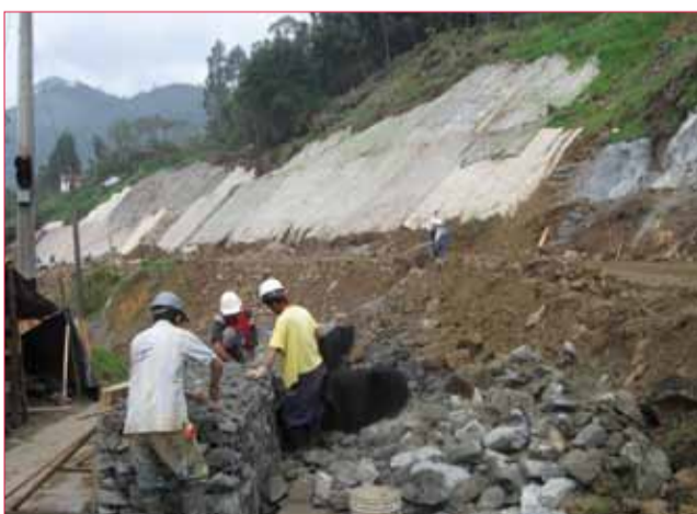
No son simples costales. Se llama agromanto y lo ponen sobre la ladera con lodo fertilizado con semillas para que peguen y luego el agromanto las proteja de rodarse cuando caiga el agua. Ese es un tratamiento que generalmente le aplican a los taludes en todas las carreteras del país.

*El trabajo publicado en esta página se realizó con fotos tomadas en el Kilómetro 10 más 700 metros el día 11 de noviembre del 2010. Es posible que cuando circule nuestra edición de noviembre haya avances. Sin embargo, la información aquí consignada fue recogida el 11 de noviembre y no cuenta con datos ni imágenes posteriores a esa fecha.