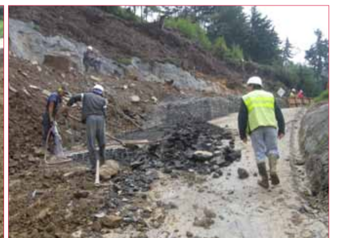
Ya no es posible dar paso ni provisionalmente. La antigua carretera está más empinada, se hundió más y construyen unos gaviones por donde antes subían y bajaban los carros. El paso, en cualquiera de sus formas, a pie o en carro, está prohibido.