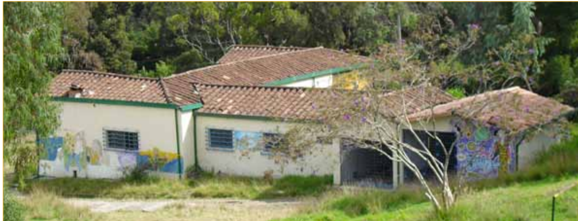
La vieja casa. Pronto se inicia la demolición.

Mucho ha esperado la comunidad de Santa Elena para ver una sede adecuada para su escuela de música. Y ya se llegó el día pues pronto se iniciarán las obras de demolición de la vieja casa que hay en la Institución Educativa para dar paso a la nueva estructura. Y la música estará agradecida