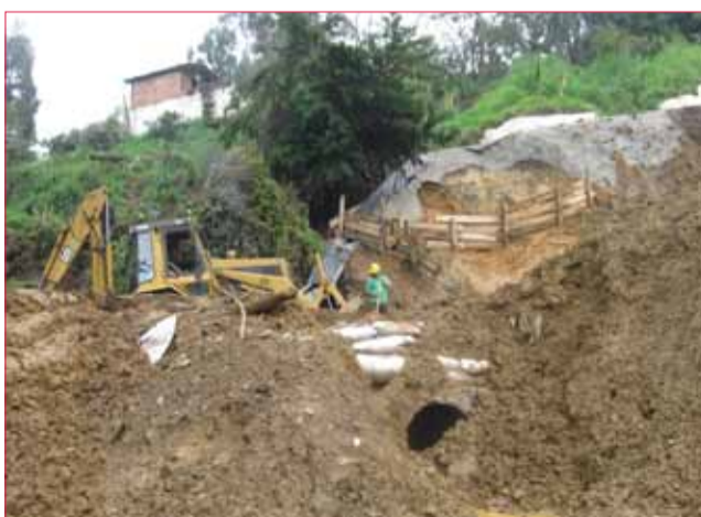
Nótese el movimiento de tierra y el tubo que recoge las aguas.