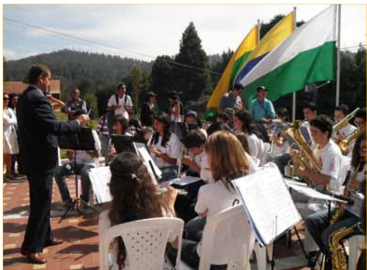
En este momento la escuela cuenta con 32 alumnos en la Banda; 15 en la pre-banda; 56 en el semillero y 30 más en iniciación.